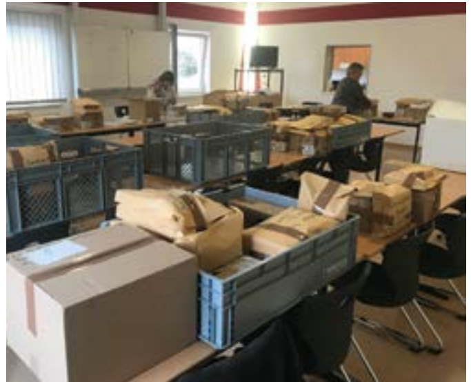
Mitarbeiter des Landratsamts schnürten die Pakete und hatten den Bedarf der einzelnen Einrichtung genau im Blick.

Gleichzeitig möchte er darauf aufmerksam machen, dass Behindertenwerkstätten, Unternehmen und Privatpersonen uneigennützig und engagiert helfen, wo sie können: „Das ist wahrlich lobenswert“. Ein Beispiel ist der Einsatz der Lebenshilfe Borna e. V. Der Verein hat sich nach Anfrage des Landrat-