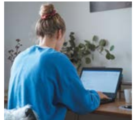
Allein und doch im Team – digitale Tools erleichtern den Austausch und die Kommunikation mit Kollegen.