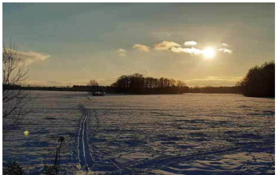
Yvonn Semek aus Brandis war auf Skiern unterwegs.