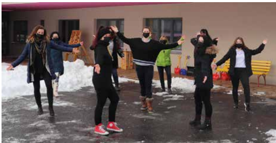
In der Kita Purzelbaum wurde gegen Corona getanzt.

Auch die Kinder begannen schon bald ihre Hüften zum bekannten Sound zu schwingen. Warum also nicht auch die Tanzschritte einstudieren. Gesagt, getan und schon war die gesamte Kita im Jerusalema-Fieber.