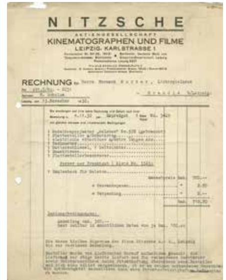
Die Rechnung belegt den Kauf des Nadelton-Projektors „Meloton“.