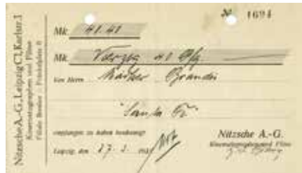
Die Quittung für den Verleih des Films „Santa Fe“.

anderen Darbietungen in Varietés. Zu den Stummfilmen gab es immer akustische Untermalungen wie klassische und populäre Musik am Klavier, ganze Orchester spielten auf, Geräuschemacher, Filmerzähler oder Klangkünstler an imposanten Kino-Organen begleiteten die Filme. In den dreißiger Jahren ist die Filmindustrie aus den Kinderschuhen gewachsen. Die Filme wurden länger, man legte Wert auf eine Handlung und Schauspieler wurden zu Stars. Das Kino war Unterhaltung für alle Altersstufen und Bevölkerungsschichten geworden.