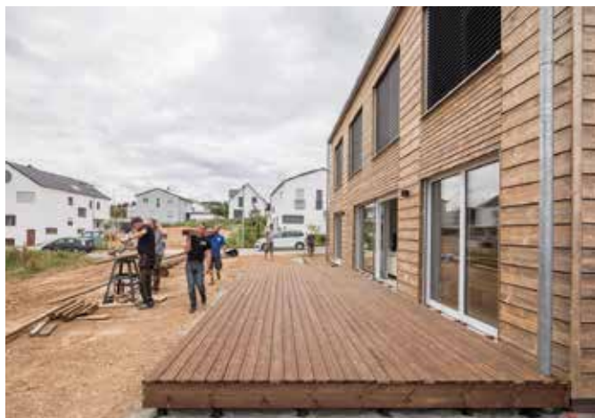
Schnell und professionell montiert: Die gemütliche Gestaltung der Terrasse ist eine Aufgabe für Profi-Handwerker.

Behaglich, hochwertig und möglichst natürlich - so lauten die wichtigsten Ansprüche an die Terrasseneinrichtung. Mehr oder minder unbequeme, wacklige Kunststoffstühle waren gestern. Heute wünscht man sich großzügige Sitzlandschaften mit hohem Komfort und natürlichen Materialien. Statt einer kleinen Grillecke soll es eine ausgewachsene Outdoorküche sein. Und auch beim Bodenbelag sind die Ansprüche sichtbar gestiegen. Verwitterte Holzdielen oder lose Platten können das gesamte Bild zunichtemachen. Stattdessen sorgen massive Holzdielen als Terrassenbelag für einen ansprechenden ersten Eindruck.