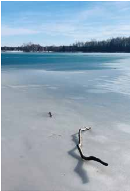
Die Farben können täuschen: Das eisige Foto am Albrechtshainer See von Sylvia Weiße aus Beucha hat etwas von Strand-Urlaub...

In der Februar-Ausgabe des Stadtjournals hatten wir Leser aufgerufen, uns ihre schönsten Winterbilder zu schicken.