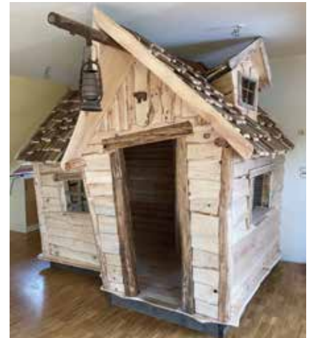
Die Bärengruppe kann sich über die neue Höhle freuen.

Verkaufsfenster und vielem mehr. Während des eingeschränkten Regelbetriebes ist es den Gruppen zwar nicht möglich, sich zu begegnen, der gewohnte Tagesablauf der Kinder wird aber beibehalten. Die Stammgruppen sind nun wie eine zweite Familie, wodurch die Kinder eine intensive Zeit mit ihren Freunden erleben dürfen. Auch die Außenflächen mussten für jede Gruppe wieder abgegrenzt werden. Dabei sind wir aber überaus dankbar, dass uns zusätzlich zum Garten der Kita auch noch das Grundstück des CVJM Hauses und das Waldgrundstück zur Verfügung stehen. Somit müssen keine Zeiten pro Gruppe für das Spielen im Freien festgelegt werden und die Kinder, die im Garten bleiben, haben genügend Platz zum Toben. In den ruhigen Zeiten drinnen beschäftigen sich die Gruppen bereits mit dem Osterfest. Jede Woche gibt es eine neue Geschichte, die auf diese besondere Zeit hinweist. In der Karwoche wird es auch wieder einen Osterweg geben. Für den Gründonnerstag hat sich die Kinderstube übrigens entschieden, den geplanten pädagogischen Schließtag ausfallen zu lassen. Nach der langen Zeit der Schließung soll dies eine Erleichterung für die Eltern sein. Den Eltern der Kinderstuben-Kinder soll an dieser Stelle ein besonderer Dank ausgesprochen werden: