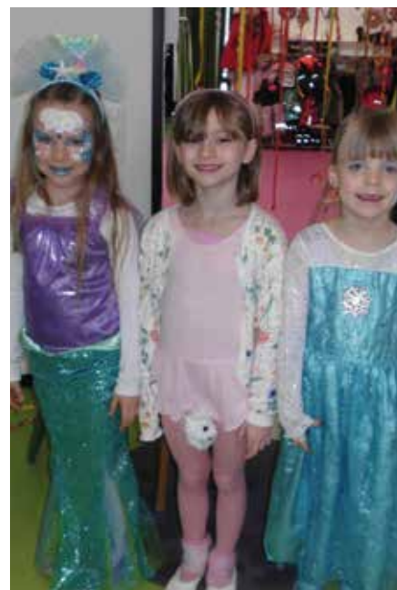
In der Kita Purzelbaum wurde in den einzelnen Gruppen Fasching gefeiert.

Die Erzieherinnen der „Schlaufuchsgruppe“