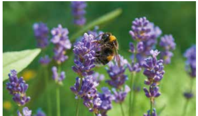
Lavendel bildet eine wertvolle Nahrungsquelle für Biene und Co.