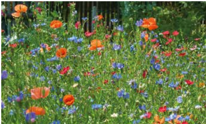
Sommerwiesen erblühen schnell mit Samenmischungen von Neudorff.

So verwandeln Sie Ihren Garten oder Balkon in eine Oase für Insekten