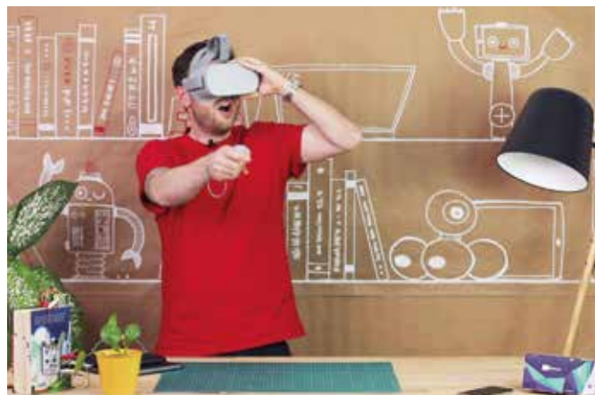
Mithilfe einer Virtual-Reality-Software werden Grundlagen der Programmierung aufgezeigt und es wird gleichzeitig dazu angeregt, selbst kreativ zu werden.

Im vierten Workshop erhalten Jugendliche einen Einblick in das virtuelle Ägypten. Per Virtual-Reality-Software werden Grundlagen