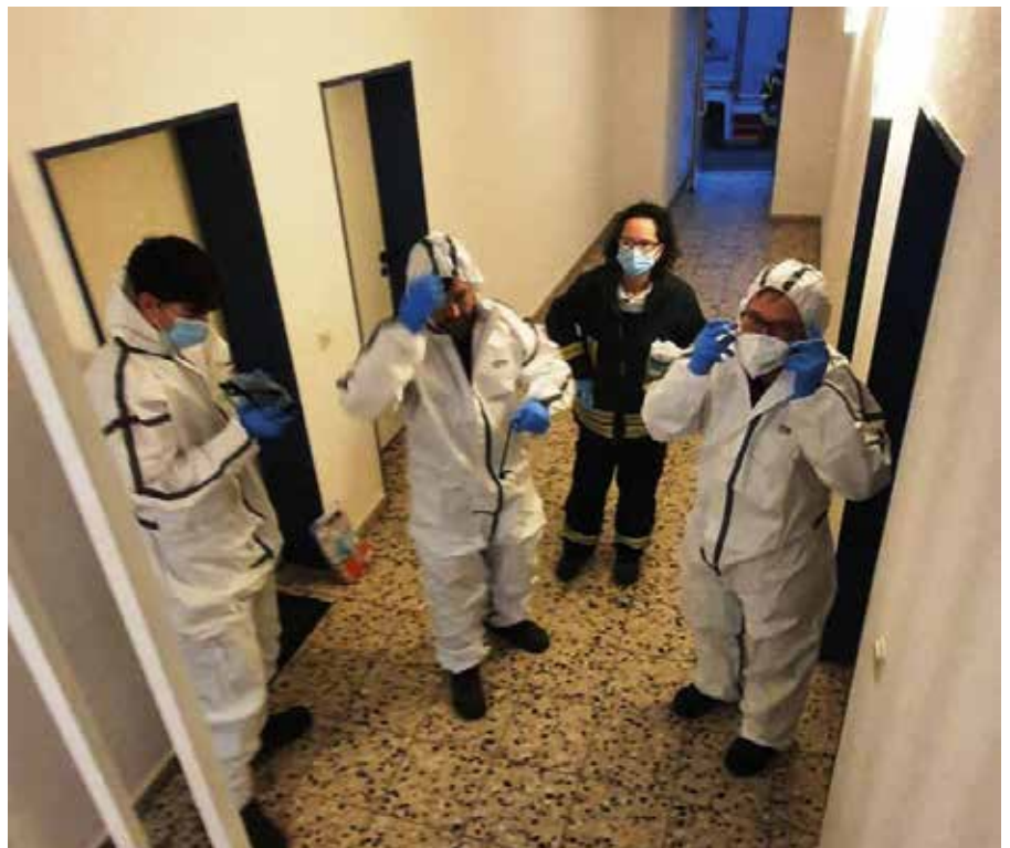
Die Kameraden schützen sich bei einem Einsatz zur Tragehilfe vor einem eventuell mit Corona Infizierten.

Die Person wurde aus der Wohnung getragen und dem Rettungsdienst übergeben.