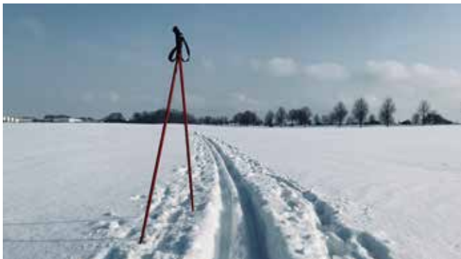
Ein verschneites Feld zwischen Beucha und Brandis fotografierte Christa Voigtländer aus Beucha. Der Schnee war so hoch, dass Skilanglauf für mehrere Tage problemlos möglich war – eine Alternative, um auch ohne Winterurlaub im Gebirge die Skier anzuschlappen.