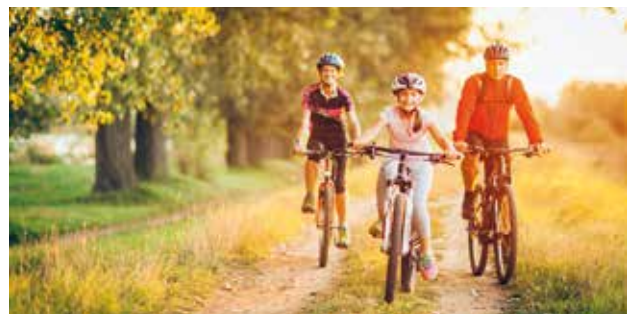
Die Region neu entdecken und kurzweilige Ausflüge mit der Familie unternehmen: Radtouren machen allen Spaß.

Das Gute liegt oft ganz nah — zum Beispiel reizvolle Ausflugsziele, die sich bequem mit dem Fahrrad oder dem E-Bike erkunden lassen. Die warme Jahreszeit bietet sich für ausgedehnte Touren mit der Familie geradezu an. Für ein sicheres Gefühl sorgt vor jeder Ausfahrt ein kurzer Check der Technik. Ist der Akku aufgeladen, funktionieren Bremsen und Licht einwandfrei, sind die Reifen in einem guten Zustand? Noch mehr Schutz vor technischen Pannen, vor Unfällen, Sturzschäden oder im Falle eines Diebstahls bieten spezielle Fahrradversicherungen. Auch der Wert von kostspieligen E-Bikes lässt sich damit umfassend absichern, bei Touren in der eigenen Region ebenso wie deutschlandweit oder im Ausland. Unter www.waldenburger.com gibt es ausführliche Informationen zur Police fürs Zweirad. djd