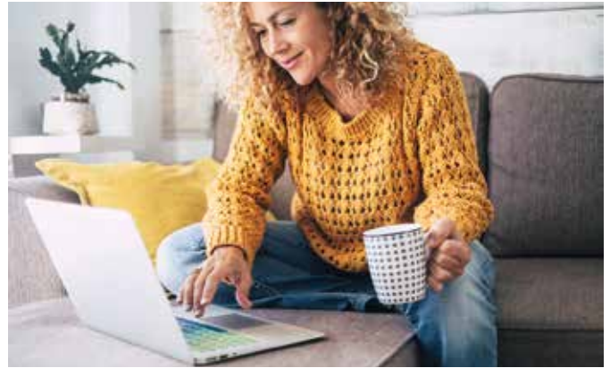
Gerade sind nur wenige Kontakte erlaubt bzw. empfohlen. Gute Freundschaften und aufbauende Gespräche sind auch telefonisch oder per Video-Chat möglich und tun einfach gut.

Je länger eine Krise dauert, desto intensiver zehrt sie an unseren Energiereserven. Wenn Gedanken um die immer gleichen Fragen kreisen und wir keine Antworten finden, kommt eine düstere Stimmung auf.