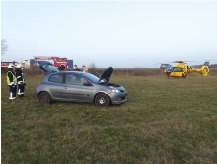
Ein Auto durchbrach an der A 14 den Wildzaun und landete auf dem Feld.