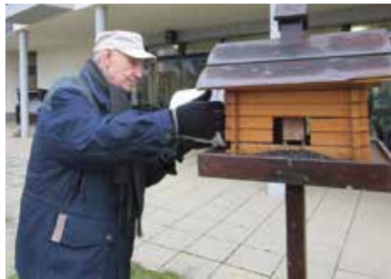
Fütterung unserer kleinen, gefiederten Freunde

Unsere Einrichtungen verfügen über ein sehr gutes Hygienekonzept. Besucher und Mitarbeiter werden zum Schutz unserer Bewohner mit sogenannten Schnelltesten regelmäßig