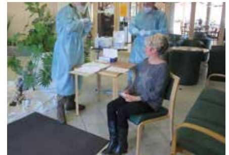
Schnelltestung der Angehörigen durch die Bundeswehr

Sicherlich kann es in Zeiten der Pandemie immer wieder zu Besucherstopps kommen, um vulnerable Gruppen zu schützen. Nach unserer behördlich angeordneten Quarantänezeit sind wir in der glücklichen Lage, in unseren Einrichtungen ein „eingeschränktes Besuchsrecht“ zu leben. Der so wichtige familiäre Kontakt findet, wenn auch eingeschränkt, wieder statt. Die Familie können