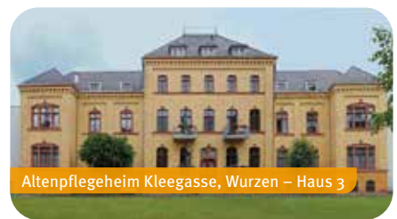
Altenpflegeheim Kleegasse, Wurzen – Haus 3

Kutusowstraße 70 | 04808 Wurzen | Telefon: 03437 9378-2000 | info@sd-muldental.de | www.sd-muldental.de