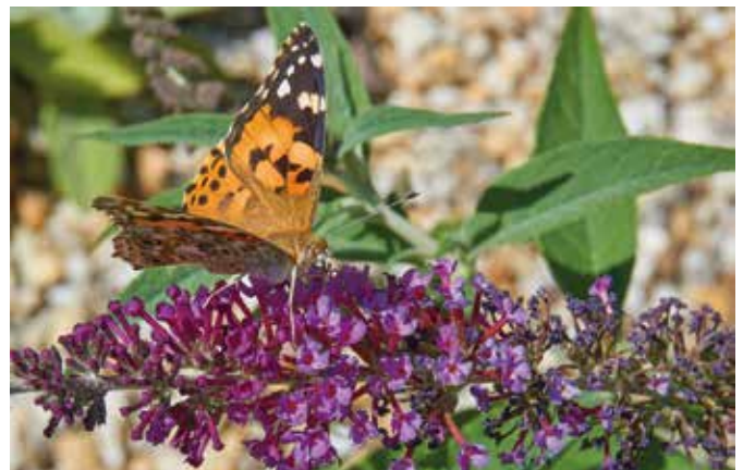
Beliebt bei Schmetterlingen: Sommerflieder