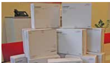
Auch für die Brandiser Einrichtungen wurden Schnelltests für die Erzieher geordert.

Seit Anfang März stehe auch in Brandis Schnelltests für Erzieher zur Verfügung. Bereits vor dem 15. Februar bestand für Erzieherinnen und Erzieher die Möglichkeit, sich bei einem Hausarzt durch einen Antigen-Schnelltest einmalig auf Kosten des Freistaates Sicherheit zu holen. Das Angebot wird nun durch regelmäßige, einmal wöchentlich mögliche Antigen-Schnelltests für das Personal an den Einrichtungen ergänzt, heißt es aus dem Kultusministerium.