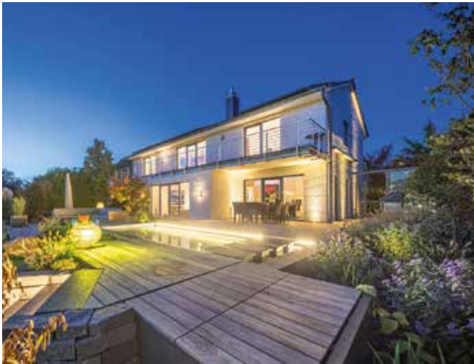
Mit hochwertigen Naturmaterialien wie edlen Holzdielen und einer stimmungsvollen Beleuchtung wird die Terrasse auch an lauen Sommerabenden zum persönlichen Lieblingsort.

oder auch für Zäune sind unverzichtbar - es sei denn, der Gartenbesitzer entscheidet sich für moderne Werkstoffe. Spezielle Verfahren machen Holz heute besonders robust und langlebig. Dabei bleibt dem Material eine natürliche Beschaffenheit erhalten, von der Maserung bis hin zur Haptik.