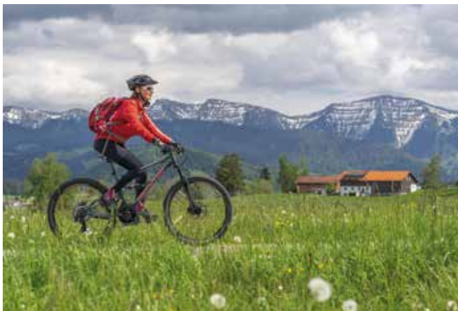
Hochwertig verarbeitete Mountainbikes sorgen für Fahrspaß.

Weiterhin profitiert jeder Mountainbiker von einem geringen Gewicht seines Rads. Vollgefederte Aluminiumrahmen sind leicht zu handhaben und sorgen für ein angenehmes Fahrgefühl. Unter www.star-shop24.com finden Interessierte eine Auswahl verschiedener Alu-Modelle. Weitere Qualitätsmerkmale bestehen darin, dass ein Rad eine zum Fahrstil passende Ergonomie aufweist, die verwendeten Materialien auf Chemikalien geprüft sind und sorgfältig verarbeitet wurden. Nicht zuletzt sollte auch darauf geachtet werden, dass am Rad nirgendwo Kleinteile überstehen, an denen die Fahrer beispielsweise mit der Hose hängen bleiben können. djd