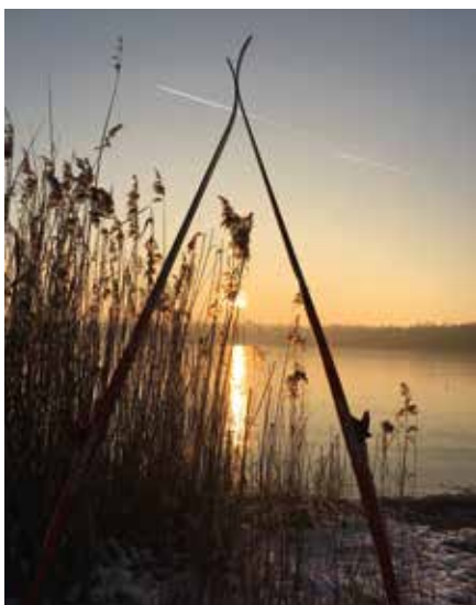
Constanze Hartung machte bei einer kleinen Skitour zum Grillensee bei Naunhof dieses Winterfoto.