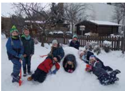
Es gab genügend Schnee, um eine Höhle daraus zu bauen. Mit Schneebällen wurde der Schnee versucht vom Dach zu schießen.

Lang, lang ist's her, dass uns die weiße Schneepacht den Winter versüßt hat. Mit tollen Aktionen im Schnee konnten die einzelnen Klassenstufen sich richtig austoben. Der große und der kleine Hof war Meter hoch von Schnee bedeckt, sodass Iglus, Rodelbahnen, kleine Schneedörfer und Schneengel entstehen konnten. Die ersten Klassen waren sehr eifrig und haben voller Tatendrang ihr Iglu gebaut. Ein riesiger Berg wurde aufgeschüttet, festgeklopft und anschließend ausgehöhlt. Nach ein paar Tagen ging es hinein in die „warme Stube“. Jedes Kind half fleißig mit und verewigte