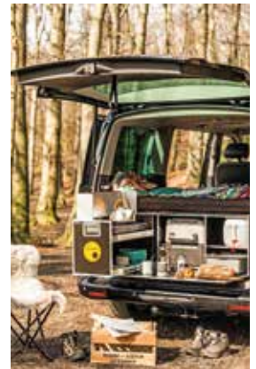
Die Küche ist schnell einsatzbereit und die Heckklappe der Box dient als Tisch.

Eine solche Campingbox hat gleich mehrere Vorteile: Die hohen Anschaffungs- und Unterhaltskosten für ein großes Wohnmobil entfallen, man benötigt keinen extra Stellplatz und auch das Fahren und Parken in den Urlaubsstädten gestaltet sich oftmals einfacher als mit einem XXL-Reisemobil. Vor allem aber steht das eigene Fahrzeug nach dem Urlaub sofort wieder zur alltäglichen Nutzung bereit. Die robuste Box wird einfach aus dem Kofferraum genommen und wartet in Garage oder Keller auf den nächsten Einsatz. Da das komplette System eine kompakte Einheit ist, muss man keine Angst haben, dabei etwas zu vergessen. Außerdem praktisch: Wer sich irgendwann ein neues Auto kauft, kann die Campingbox weiterverwenden. Ob VW Caddy, Toyota Proace City, Renault Kangoo, Mercedes Citan oder Opel Combo: Ein Modul passt in rund 35 dieser Hochdachkombis, ein anderes in über 60 Busse und Transporter. Unter www.ququq.info finden sich Listen aller passenden Fahrzeugmodelle zum Downloaden, darunter auch Ausführungen für Geländewagen.