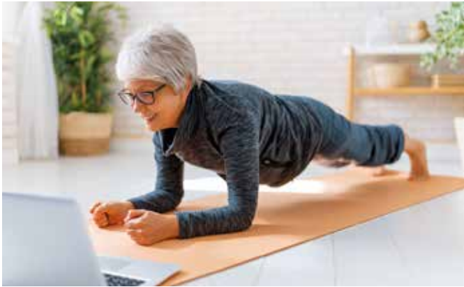
Auch körperliche Bewegung wie Wandern oder Wohnzimmer-Gymnastik tut gut und vertreibt düstere Gedanken.