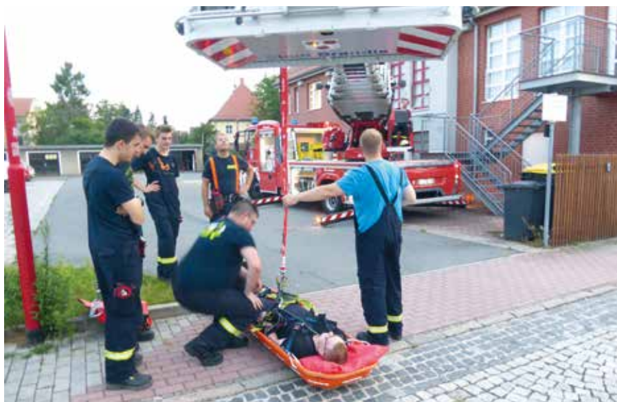
Die Kameraden zeigten die Rettung einer Person mittels Drehleiter.

Freitags 20 Uhr Feuerwehrgerätehaus. Interessierte Bürger(innen) sind herzlich eingeladen.