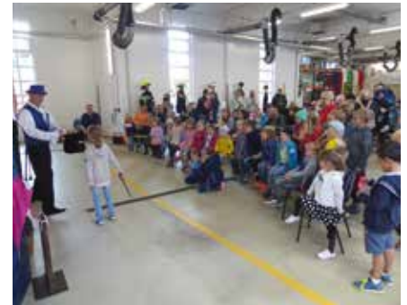
Zum Tag der offenen Tür war unter anderem ein Zauberer im Gerätehaus zu Gast und begeisterte kleine und große Besucher.

Löschen mit der Polenzer Handdruckspritze und Löscheinern demonstriert. Als nächstes kam ein Traktor mit Tragkraftspritzenanhänger zum Einsatz. Zum Abschluss kam ein DDR-Tanklöschfahrzeug Baujahr 1967 mit 2000 Liter Wassertank zur Brandbekämpfung vorgefahren. Eröffnet wurde die Veranstaltung musikalisch durch die Brandiser Stadtmusikanten. Ein Highlight für die Kinder waren die einstündige Zaubershow und viele Spielattraktionen. Selbstverständlich kam auch die Feuerwehrgegenwart nicht zu kurz. Wir zeigten unsere Einsatztechnik und unser Gerätehaus. Die Jugendfeuerwehr führte eine Grundübung mit dem Löschfahrzeug durch und die Einsatzabteilung zeigte die Möglichkeiten der Drehleiter.