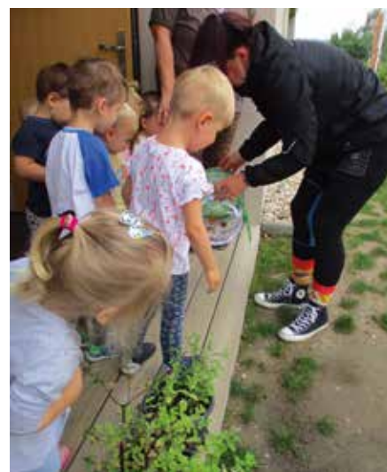
Die Kinder konnten beobachten, wie die Raupe zum Schmetterling wird.

Mit Beginn des neuen Kita-Jahres wechselten Anfang September auch viele kleine, aufgeregte Vorschüler in die Schlaufuchsgruppe, die ihre „Großen“ mit dem Schulanfang in die Grundschule verabschiedeten. Wir wünschen allen eine schöne und span-