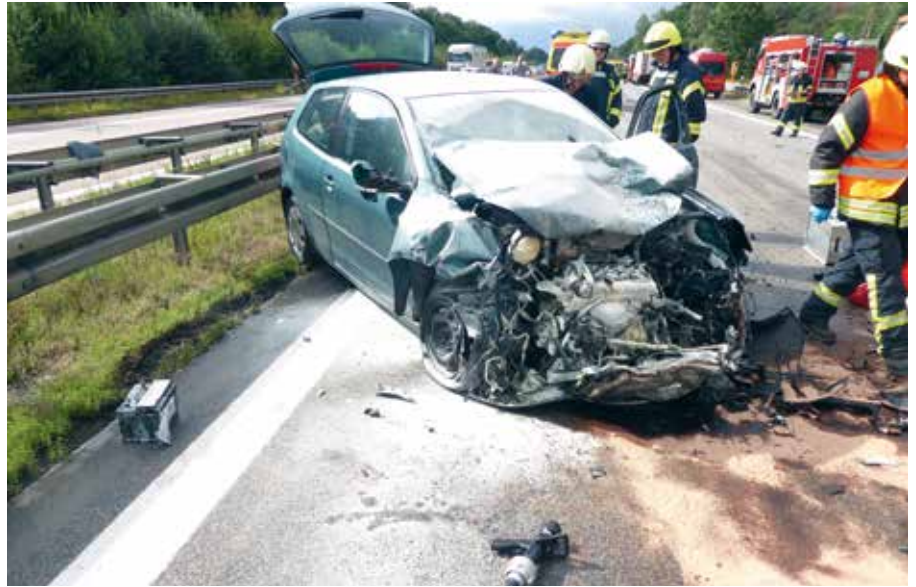
Bei einem Verkehrsunfall auf der Bundesautobahn 14 sicherten die Kameraden die Einsatzstelle ab und nahmen auslaufende Betriebsstoffe auf.

Am 28. August veranstalteten wir unseren Tag der offenen Tür im Rahmen des 900-jährigen Stadtjubiläums. Dafür haben wir uns mit unserer Historik beschäftigt und eine Ausstellung über Bekleidung und Ausrüstung im Wandel der Zeit präsentiert. Um die Historik lebendig werden zu lassen, zeigten wir drei Einsatzübungen. Zuerst wurde das