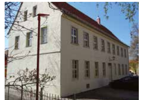
Gemeindehaus nach der Innen- u. Außensanierung 2019