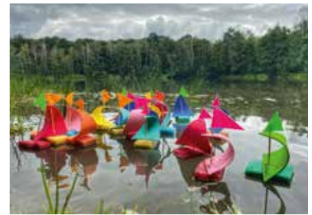
Die Kinder ließen beim Waldtag ihre selbstgebauten Segelboote übers Wasser schippen.

Der letzte Höhepunkt für unsere Vorschüler bestand dann im Zuckertütenfest, kurz vor dem Schulanfang. Kinder, Eltern und Mitarbeiter erlebten und genossen einen ganz besonderen Nachmittag, an den wir uns sicher noch gern und lange erinnern werden. Zuerst erlebten alle ein buntes Programm zum Thema „sei behütet“. Dann schloss sich