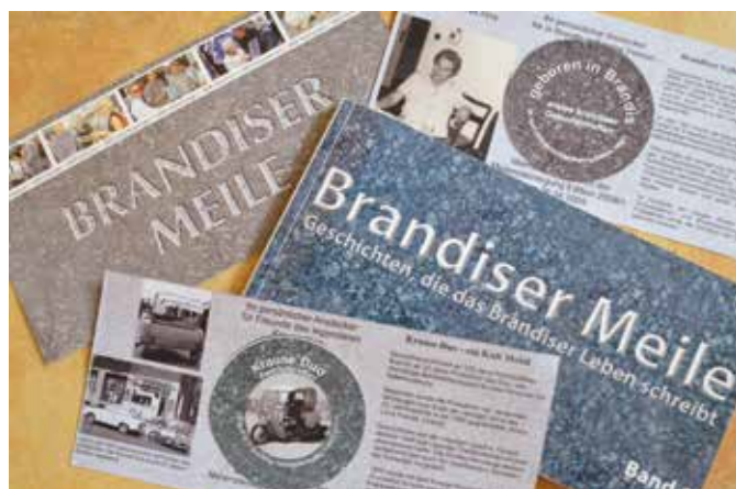
Broschüren, Flyer, Sticker: Der Brandiser Meilen-Verein hat in den vergangenen reichlich 15 Jahren mit einer Vielzahl von Aktionen auf sich aufmerksam gemacht.

Weitere Informationen unter: www.7seen-wanderung.de