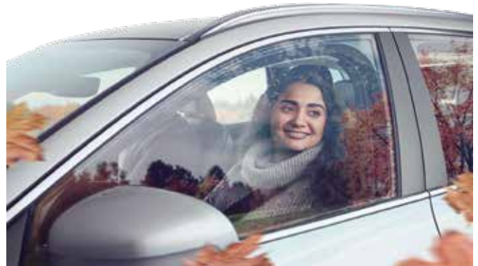
Wenn auf die Technik Verlass ist, kommt man auch bei ungemütlichem Wetter entspannt und sicher ans Ziel.

Fahrweise der Witterung anpassen: Zum üblichen Testprogramm in den Werkstätten gehören neben der Batterie, der Beleuchtung sowie den Scheibenwischern auch die Bremsanlage, der Motor und die Fahrzeugelektronik. So sind etwa die Bremsen bei rutschigen Straßenverhältnissen besonders gefordert, frische Beläge können die Sicherheit erheblich steigern. Adressen von Fachbetrieben aus der eigenen Region finden Autofahrer beispielsweise unter www.boschcarservice.com/de/de . Außerdem gibt es hier nützliche Tipps zum sicheren Fahren in jeder Jahreszeit. Wichtig ist es unter anderem, die eigene Fahrweise anzupassen, bei rutschigen Straßenverhältnissen abrupte Lenk- und Bremsmanöver zu vermeiden sowie vorausschauender zu fahren. djd