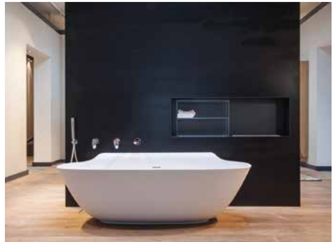
Auf dem Vormarsch bei der freistehenden Wanne ist das Material Mineralguss. Es ist optisch wie haptisch Naturstein sehr ähnlich – mit dem großen Vorteil, dass es in puncto Gewicht deutlich leichter ist und bei der Verarbeitung kaum an Grenzen stößt.

Den sendet der Verbraucher mit ersten Ideen und Bedürfnissen zur Orientierung für die Fachleute an Elements zurück. Dabei unterstützt auch die neue Merkzettel-Funktion, mit der die ersten Wunschprodukte von Armatur bis freistehende Wanne gespeichert werden können. Bei der anschließenden Video-Beratung geht der Ausstellungsmitarbeiter auf diese Vorgaben und Vorlieben ein, plant „live“ das neue Traumbad und erstellt daraufhin in Abstim-