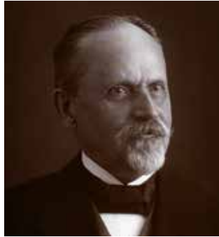
Oskar Müller (1890 – 1919)

1906 „Frauenhilfsverein Cämmerei“ gegründet