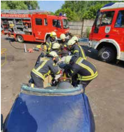
Bei dem Lehrgang wurde unter anderem das Retten von Personen nach Verkehrsunfällen ausgebaut und verfeinert.

Eigentlich sollte der Lehrgang bei der Ortsfeuerwehr Beucha schon im November 2020 abgeschlossen werden. Doch der coronabedingte Lockdown machte den angehenden Truppführern mehrfach einen Strich durch die Rechnung. Im dritten Versuch durfte der Lehrgang dann doch im Juli durchgeführt werden. Im Lehrgang zum Truppführer der Freiwilligen Feuerwehr lernten die 14 Ka-