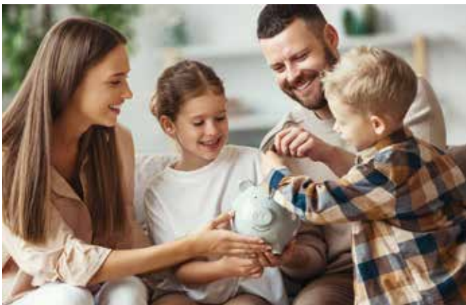
Die eigene Altersvorsorge selbst in die Hand nehmen und im Alter finanziell entspannt dastehen.