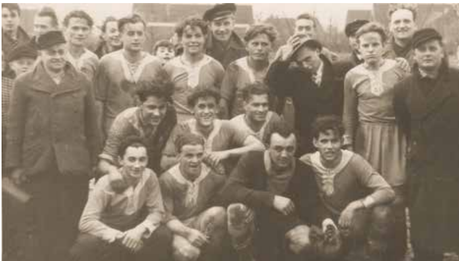
Die Brandiser Herren 1951

10.30 Uhr Punktspiel unserer C-Junioren SpG Partheland / FSV Brandis gegen Döbelner SC II