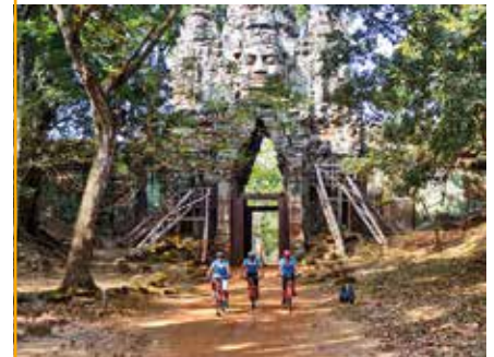
Termin- u. Programmänderungen vorbehalten. Ein Anspruch auf Vollständigkeit besteht nicht. Alle Angaben ohne Gewähr.