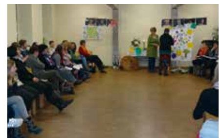
Feier des Weltgebetstages