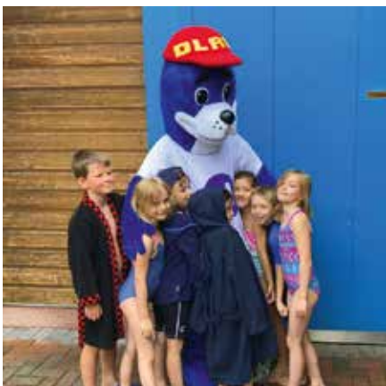
Nobbi besuchte die Schwimmer unter anderem in Naunhof.

Corona und geschlossene Schwimmbäder. Als im Frühling vielerorts noch gar nichts ging bereitete die DLRG Parthenaue e.V. Kurse für das Anfängerschwimmen vor. Der Einstieg erfolgte zu Beginn teilweise über Online-Seminare mit Anleitungen