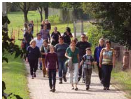
Ausflug der Konfirmandenfamilien