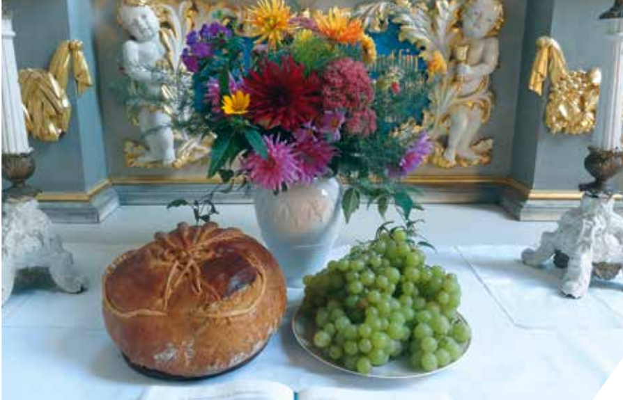
Stadtkirche Brandis – Erntedankfest