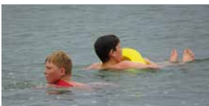
Beim Parthe-Cup wurde u.a. der Umgang mit verschiedenen Rettungsmitteln gezeigt.

Leben zu retten erfordert Kraft, Kondition, Schnelligkeit und die Beherrschung der Rettungsgeräte. Der in diesem Jahr erstmalig stattfindende Parthe-Cup ist als rettungssportlicher Wettkampf für unseren