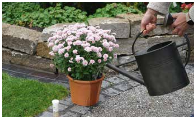
Für ein gesundes Wachstum: Mit natürlichen Produkten lassen sich die pflanzeigenen Abwehrkräfte nachhaltig stärken.

Die Anwendung ist unkompliziert. Dazu einfach alle vier Wochen dem Gießwasser eine Brausetablette hinzufügen. Bei größeren Bee-