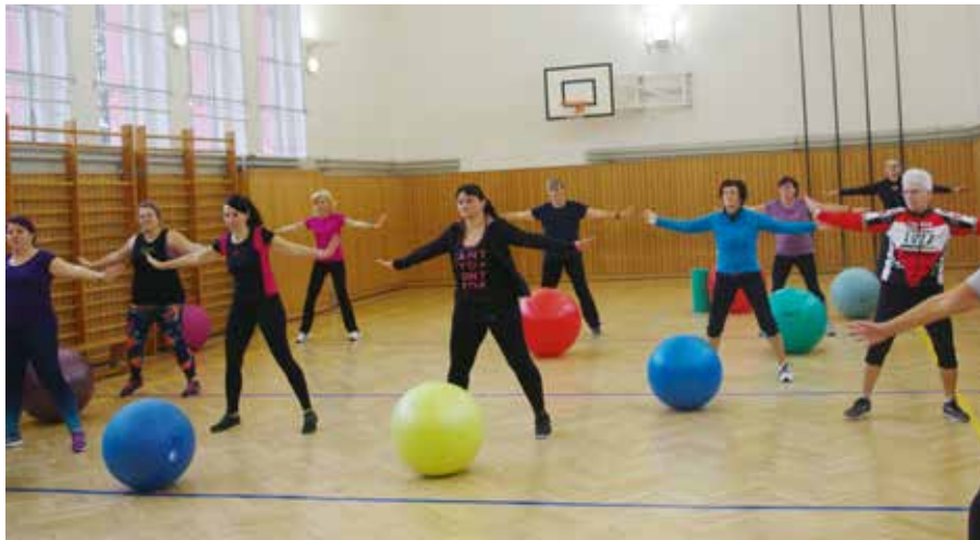
Mit dem regelmäßigen Sport soll u.a. die Beweglichkeit des Körpers erhalten bleiben.

Mit genügend Sport können wir Stoffwechsel und Energieverbrauch aufpeppen. Die Ziele liegen in der funktionellen und richtigen Beanspruchung des Körpers und der Erhaltung unserer Beweglichkeit, die wir durch die Mobilisation erreichen. Bei