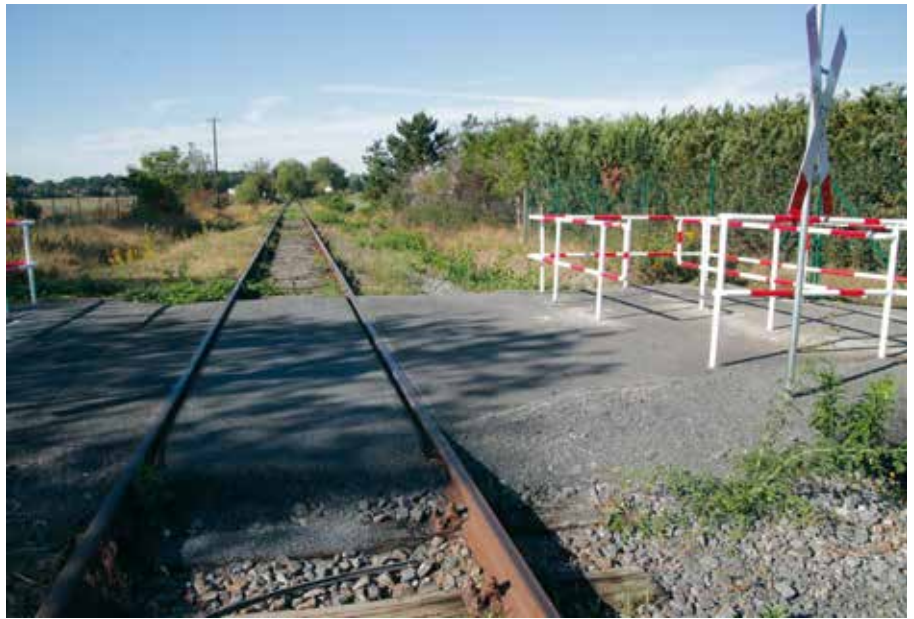
Mit dem Gutachten steht eine Reaktivierung der Strecke Beucha–Brandis bis nach Trebsen auf dem Prüfstand.