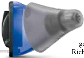
Foto: Silk X von Sigma

Helfer Hörsysteme www.helfer-hoersysteme.de