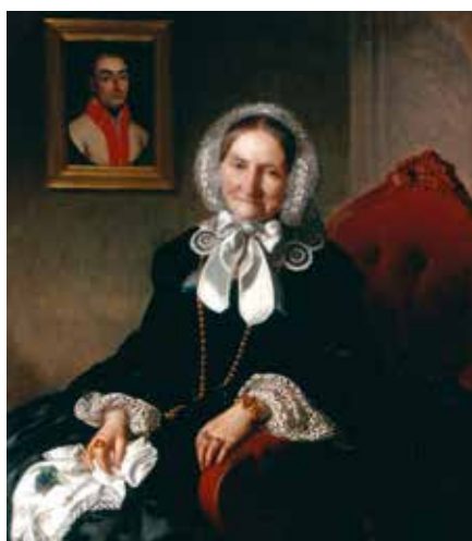
Ernestine Friederike von Pentz (* 1788 in Weichselburg + 1875 in Brandis)