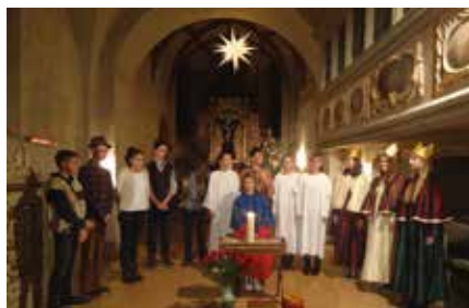
Krippenspiel der Erwachsenen 2019 in Beucha