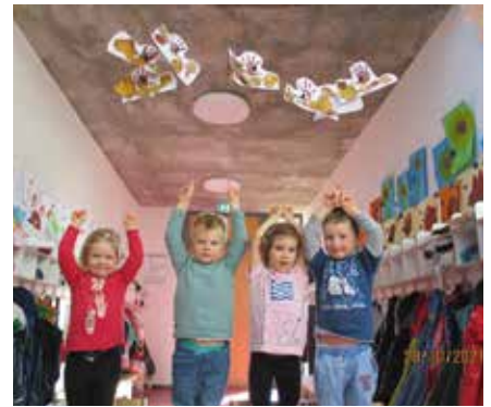
Selbstgebastelter Herbstschmuck ist in der Kita PurzelBaum derzeit überall zu finden.

An einem schönen Herbsttag gingen die Turboschnecken in den Wald, um die