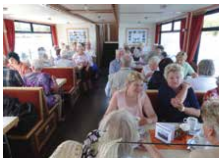
Ausflug des Frauendienstes 2019