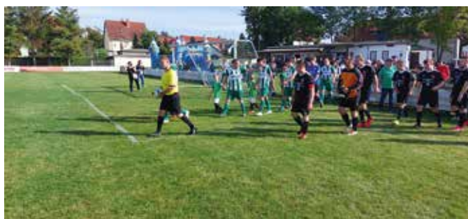
Ein Freundschaftsspiel der 1. Herrenmannschaft gegen Blankensee gehörte ebenfalls zum Programm.