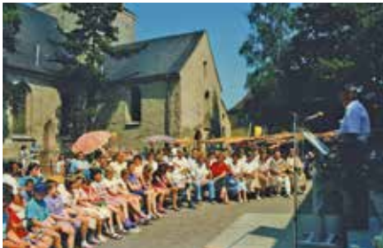
Frühlingsfest der Kirchgemeinde 1992 auf dem Kirchplatz

Seit 2020 wird die Kirche im Inneren schrittweise saniert.