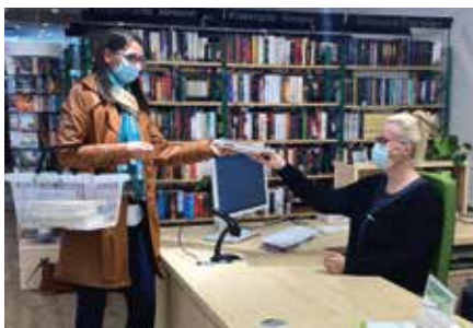
In der einen Partheland-Bibliothek das Buch ausleihen, in einer anderen wieder abgeben: Das kann man jetzt bequem innerhalb des Verbundes der Partheland-Kommunen.

Wer sich bis dato ein Buch oder ein anderes Medium in einer der Partheland-Bibliotheken ausgeliehen hatte, musste dieses auch stets