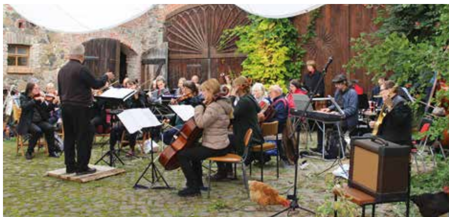
Das Erste Leipziger Familienorchester spielt im Dreiseithof.

Für 2022 werden weitere Konzerte und Hoffeste geplant. Das Jahr beginnt mit einem Klaviermatinee: Am Samstag, dem 1. Januar um 15 Uhr gibt Mariko Mitsuyu ein Neujahrsmatinee mit Werken von Franz Schubert und Franz Liszt. Karten (16, ermäßigt 14 Euro) können unter a.jones@einigkeit4.de oder telefonisch (034292 74791) reserviert werden. Auch hier gilt die jeweils aktuelle Corona-Regelung. Das musikalische Hoffest findet am Sonntag, dem 3. Juli 2022 statt.