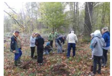
Arbeitseinsatz im Kirchenwald Polenz 2019