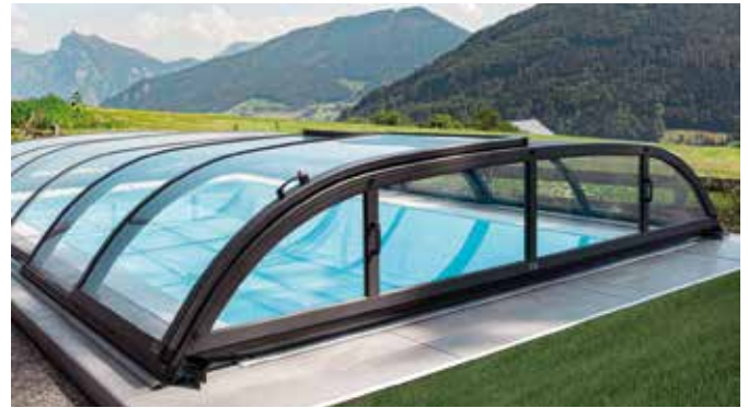
Bei einem Überlaufpool mit Infinity-Effekt reicht der Wasserspiegel bis zur Kante und läuft gleichmäßig über den Beckenrand in die ihn umlaufende Rinne. Auch einen solchen Pool gibt es als Komplett-Set. (likns) Experten empfehlen, die Poolabdeckung von vornherein mit einzuplanen. (rechts

mit der Umgebung eine Einheit und vermittelt beim Schwimmen ein Gefühl der Weite. Zudem bietet er eine bessere Wasserzirkulation bei geringerem Reinigungsaufwand.