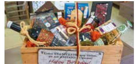
Das erfolgreiche Naunhofer Konzept - Blumenarrangements zu jedem Anlass, farbenfrohe blühende Pflanzen für den Innen- und Außenbereich, köstliche Präsente und zauberhafte Dekorationen - hält nun auch in Leipzig / Engelsdorf Einzug.