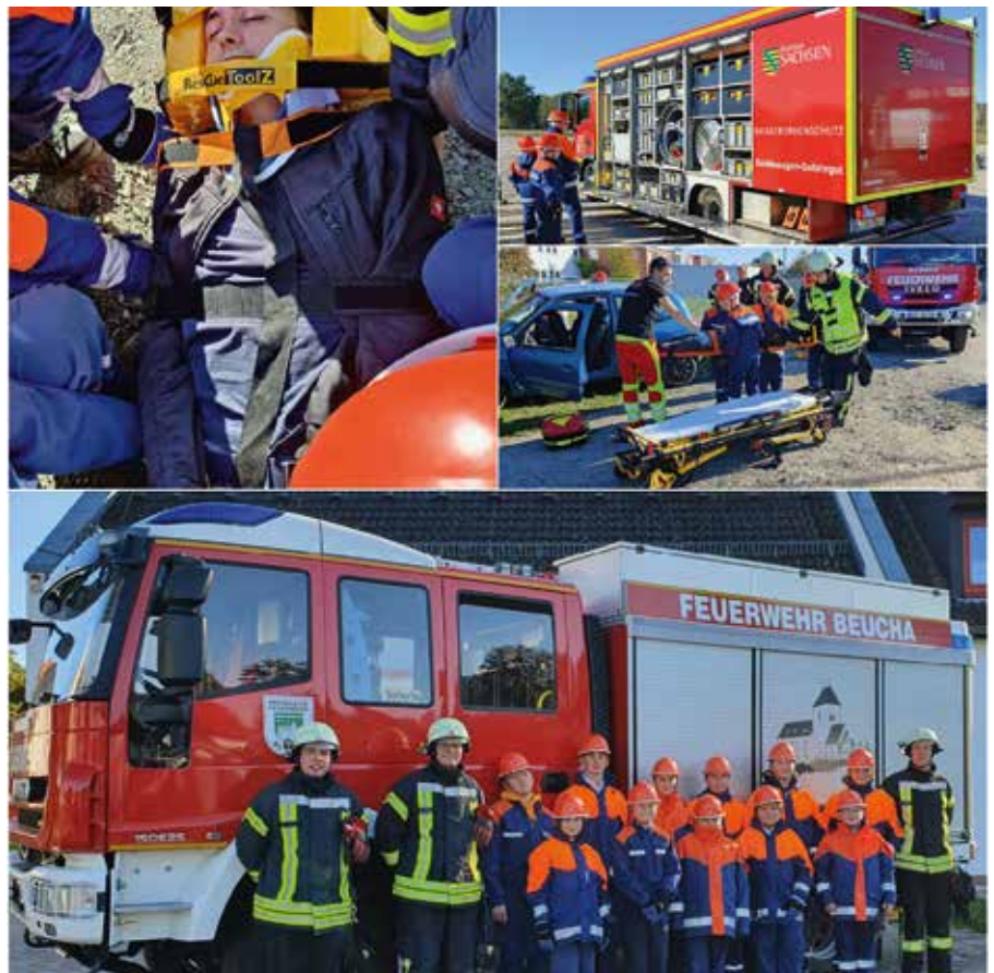
Vielseitig wurde der 24-Stunden-Dienst in Beucha verbracht.

Die Dienstpläne finden Sie auf: www.ffw-beucha.de .