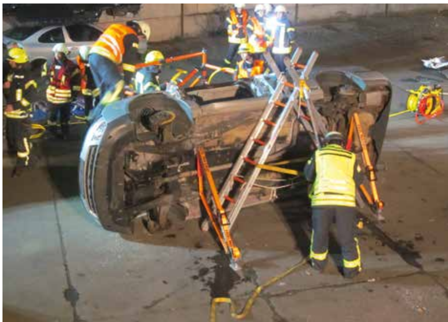
In der Ausbildung wurde u.a. das Retten von Menschen aus einem Pkw in Seitenlage geübt.

Auf einen Parkplatz beseitigten wir eine Öllache. Unter den vielen Einsätzen hatten wir lediglich einen Brandeinsatz. Am 19. Oktober rückten alle Ortsfeuerwehren zu einem Schornsteinbrand nach Polenz aus. Um eine thermische Beanspruchung zu minimieren und somit das Zerplatzen des Schornsteines zu verhindern galt es, die Zirkulation im Innerern des Schornsteines sicher zu stellen. Dabei unterstützte uns der Schornsteinfegemeister. Der erste Sturm im Herbst bescherte uns insgesamt 24 Einsätze, die durch die Ortsfeuerwehren Beucha, Polenz und Brandis gemeinsam abgearbeitet wurden. Unsere Aufgaben waren die durch umgestürzte