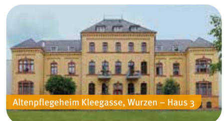
Altenpflegeheim Kleegasse, Wurzen – Haus 3

Kutusowstraße 70 | 04808 Wurzen | Telefon: 03437 9378-2000 | info@sd-muldental.de | www.sd-muldental.de