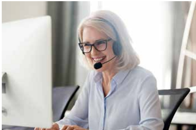
Ob privat oder beim Arbeiten: Das Sprechorgan wird ständig beansprucht.

Halstabletten einer belasteten Stimme zuverlässig bei Symptomen wie Heiserkeit, Räuspern oder Halskratzen helfen. Durch das enthaltene Isländisch Moos werden Hals und Rachen beruhigt und der Reiz gelindert. djd