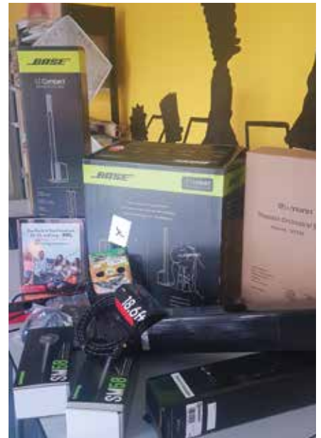
Technik für verschiedenste Veranstaltungen innerhalb der Kinder- und Jugendarbeit konnte über den Bürgerfonds beschafft werden.

Gemeinsam mit einer Lehrerin hat sich der Schülerrat das Ziel gesetzt, ein Mülltrennungskonzept für das Gymnasium Brandis umzusetzen. Bisher kamen alle Abfälle in eine große Tonne. In jedem Zimmer und Gang steht nun ein dreigeteilter Mülleimer. Letzte Schritte für die Umsetzung werden noch mit der Reinigungsfirma abgestimmt. Für eine grüne Schule bzw. eine grüne Stadt und eine saubere Umwelt war die Umsetzung des Projektes essenziell.