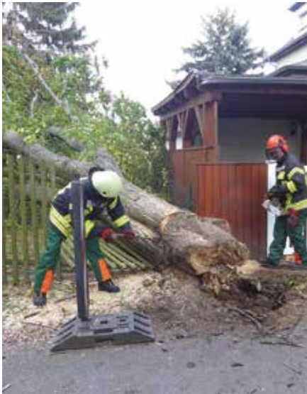
Vielseitig wurde der 24-Stunden-Dienst in Beucha verbracht.

Bäume blockierten Straßen zu beräumen, abgebrochene Äst und Bäume aus Telefon- und Stromleitungen zu entfernen und ein Haus vor einem umsturzgefährdeten Baum zu schützen.