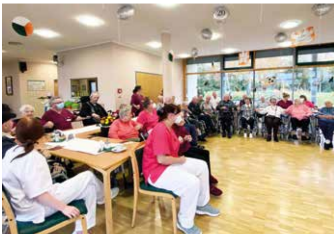
Bewohner und Pflegekräfte schunkeln fröhlich zur Musik

Soziale Dienste Muldentalkliniken Unternehmensgruppe