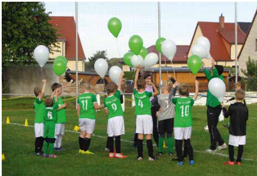
Grün-weiß war die Darbietung der Bambinis und F-Jugend vom FSV 1921 Brandis.