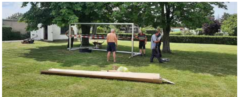
Im Kleingartenverein Frohsinn wurden neue Spielgeräte aufgebaut.