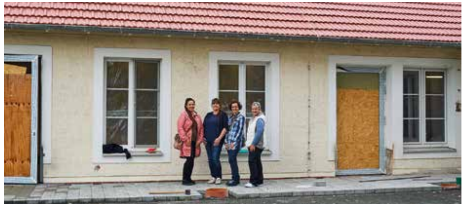
Wir freuen uns auf Sie in der Hugo-Aurig-Straße 7, direkt gegenüber dem ALDI Engelsdorf.

Viel Wert legen die Fachfloristinnen darauf, woher die Waren stammen: Europäische oder weltweit fair-gehandelte Schnittblumen und Pflanzen von vorwiegend deutschen Gärtnereien, falls möglich in BIO-Qualität.