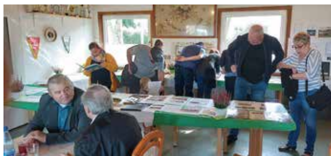
Die Ausstellung zu 100 Jahre FSV 1921 Brandis war gut besucht.