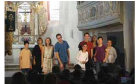
Jugendliche führen 2018 das Theaterstück „Jakob und Esau“ auf