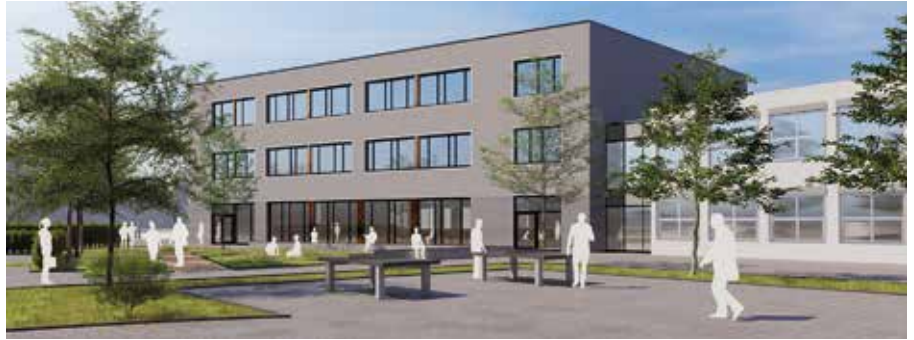
So soll sich der Neubau an das vorhandene Schulhaus anschließen.