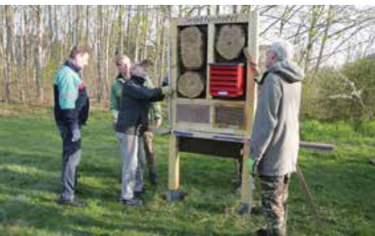
Insektenhotels wurden im Stadtpark Brandis und am Autobahnsee Beucha – hier zu sehen – aufgestellt.

Auf besondere historische Örtlichkeiten möchte der Bürgerverein Brandis e.V. mit seinem Projekt in Brandis hinweisen. Sie werden noch in diesem Jahr mit Tafeln versehen, auf denen ein kurzer Erläuterungstext über die jeweilige Geschichte informiert. So soll das Geschichtsbewusstsein der Bewohner gestärkt und die touristische Attraktivität aufgewertet werden. 🌸