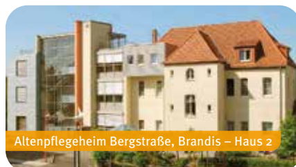
Altenpflegeheim Bergstraße, Brandis – Haus 2