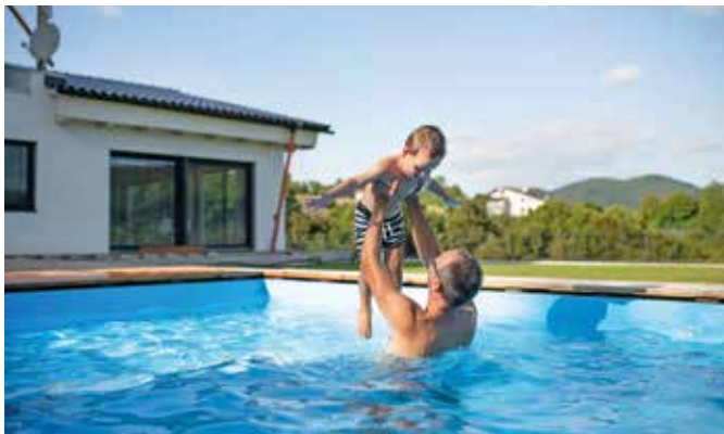
Gerade für Kinder gibt es kaum etwas Schöneres als den Pool im eigenen Garten.

Wer ganz sichergehen will, im Sommer 2022 im eigenen Pool planzen zu können, sollte ihn in den kommenden Herbst- und Wintermonaten planen. Im Frühling, wenn die Temperaturen langsam steigen, kann es sonst zu längeren Wartezeiten kommen, weil die Auftragsbücher der Hersteller dann wieder sehr gut gefüllt sein werden. Nach einer Schwimmbadplanung ohne Zeitdruck und dem Ausheben der Baugrube wird das Becken pünktlich zur warmen Jahreszeit angeliefert und eingesetzt. Hier sind die wichtigsten Punkte, die man dazu wissen sollte: