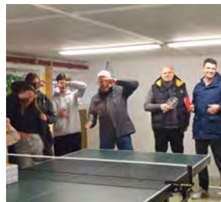
Übergabe Tischtennistisch im Kinderheim in Waldsteinberg.