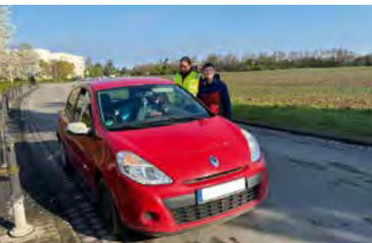
Geschwindigkeitskontrollen der Polizei mit Grundschulern sollen die Sicherheit der Kinder im Straßenverkehr erhöhen.

Am 20. April 2026 begann in Sachsen die zweiwöchige landesweite Verkehrssicherheitsaktion „Blitz für Kids“. Geschwindigkeitskontrollen der Polizei mit Grundschulern sollen die Sicherheit der Kinder im Straßenverkehr erhöhen. Auch in Beucha beteiligte sich die Polizei an der Aktion. Am