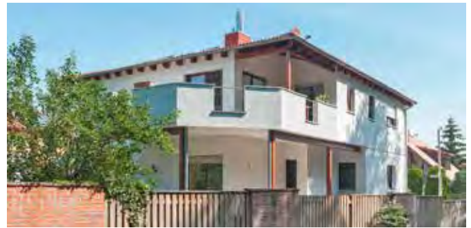
Aus eins mach zwei: Nach einer Dachaufstockung wurde dieses Haus um eine helle, einladende Wohnung mit Balkon und separatem Eingang erweitert und dabei den aktuellen Energiestandards angepasst.

Käufer von älteren Immobilien finanziell bei der energetischen Sanierung. Eine Aktion, die sich im Hinblick auf Verfügbarkeit und Preise von freien Grundstücken auszahlt. Ob Anbau, Umbau oder Modernisierung: Mit einer Kombination aus langjährigem Know-how, Handwerkskunst und neuester Technologie kümmert sich Wolf-Haus um die Realisierung des persönlichen Traumhauses und macht es fit für die Zukunft.