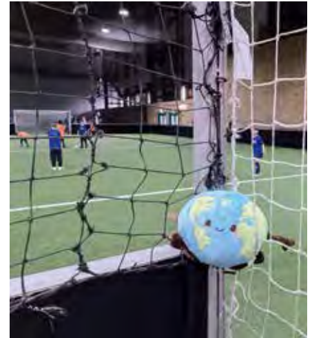
Beim Schülerpokal in Leipzig gaben die Brandiser ihr Bestes.

Alle Kinder bekamen ein Trinkpäckchen und Gummibärchen. Das hat viele gefreut und ein bisschen geholfen, sich besser zu konzentrieren. Die Schüler und Schülerin-