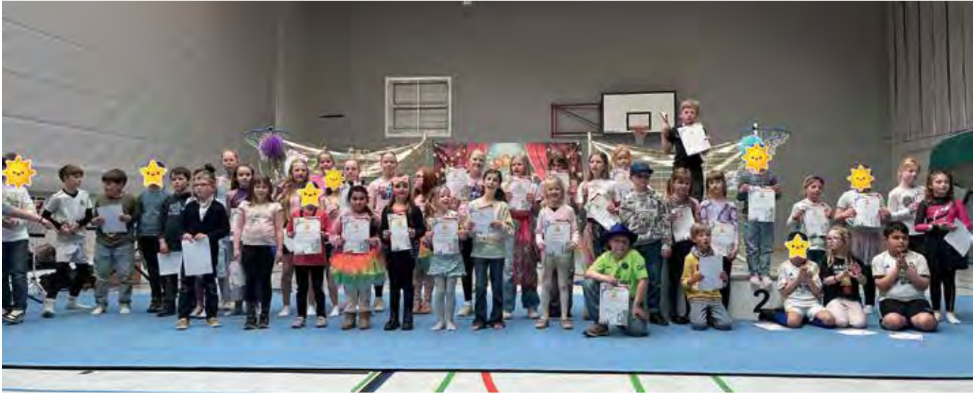
Bei einer Talentshow bewiesen die Kinder ihr Potenzial.

Am 15. April verwandelte sich unsere Mehrzweckhalle in eine Bühne für die Stars von morgen: Bei einer außergewöhnlichen Talentshow traten ausschließlich Kinder aus unserem Hort auf und zeigten ihr Können in den Bereichen Musik, Ballkunst, Gesang und Tanz. Vor Eltern, Großeltern und anderen Kindern präsentierten die kleinen Künstlerinnen und Künstler ein buntes und abwechslungsreiches Programm, das das Publikum von der ersten bis zur letzten Minute fesselte.