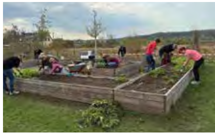
Mit vereinten Kräften wurden die Hochbeete von Unkraut befreit.

Auch die Pflanzenwelt kam nicht zu kurz. Das Zyperngras vor der Kita erhielt eine fachgerechte Verjüngungskur. Es wurde zurückgeschnitten und erstrahlt nun wieder in frischem Glanz. Auch ausgerangierte Gummistiefel der Kinder erhielten ein zweites Leben. Mit frischer Erde befüllt und liebevoll neu bepflanzt, schmücken sie nun wieder als originale Blumenkästen den Außenbereich der