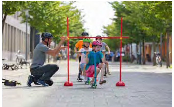
Mehr Zeit für Mobilitätsbildung – ein klarer Wunsch der Lehrerinnen und Lehrer in Deutschland

„Die Umfrage zeigt Verkehr wird nicht nur mehr, sondern auch vielfältiger. Leise E-Autos, Roller oder Lastenräder stellen neue Anforderungen an Aufmerksamkeit und Orientierung. Kinder brauchen deshalb mehr Zeit, um zu lernen, sich sicher und gleichzeitig selbstständig in dieser komplexeren Mobilitätswelt zu bewegen“, sagt Christina Tillmann, Vorständin der ADAC Stiftung. Insbesondere der Weg zur Schule ist in der Gruppe der 6- bis 14-Jährigen risikobehaftet. Im Jahr 2024 verunglückten 27.260 Kinder dieser Altersgruppe im Straßenver-