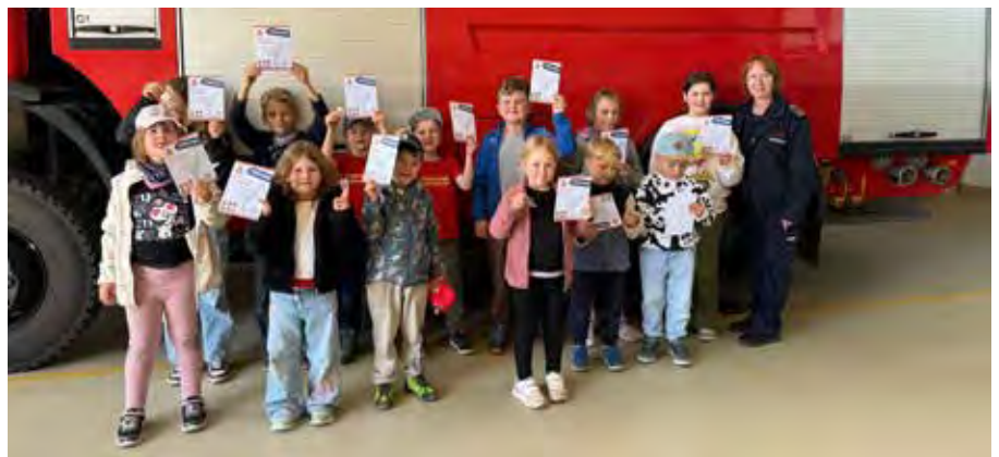
Auf dem Gelände der Regionalbus GmbH in Deuben wurde die Kinderflamme der Stufen 1 und 2 abgenommen.

Kein Aprilscherz: Am Morgen des 1. Aprils wurden die Einsatzkräfte der Feuerwehr Beucha gleich zweimal ins Gerätehaus alarmiert. Zunächst löste eine automatische Brandmeldeanlage aufgrund eines defekten Sprinklers aus. Der betroffene Bereich wurde kontrolliert, anschließend konnte die Anlage zurückgesetzt werden. Nur kurze Zeit später erschien das Stichwort „Tier in Not“ auf den Funkmeldeempfängern der Kameraden. Vor Ort stellte sich heraus, dass mehrere Kühe in den Straßenbereich gelangt waren. Nach Rücksprache mit der Besitzerin bestätigte sich die Lage teilweise. Die ausgebüxten Tiere konnten jedoch bereits eingefangen und zurück auf ihre Weide gebracht werden, sodass für die Feuerwehr kein Eingreifen erforderlich war. Am 13. April wurde das Tanklöschfahrzeug aus Beucha zu einem Brand in die Ortslage Polenz alarmiert. Dort brannte ein etwa drei Meter langer Grünstreifen. Da die Löschwasserversorgung vor Ort ausreichend war, mussten die Beuchaer Einsatzkräfte nicht tätig werden. Der Brand wurde von den Polenzer Kameraden gelöscht. Am 27. April unterstützten die Einsatzkräfte zunächst den Rettungsdienst bei einer Tragehilfe. Später am selben Tag rückten sie mit dem Hilfeleistungslöschgruppenfahrzeug (HLF) zu einer Türöffnung aus. Noch vor dem Eingreifen der Feuerwehr konnte die Patientin die Tür jedoch selbstständig öffnen, sodass kein weiteres Handeln erforderlich war.