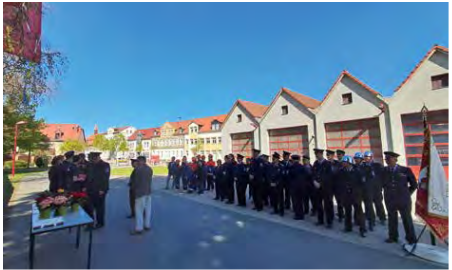
Bei strahlendem Sonnenschein wurden die Ehrungen in Brandis vorgenommen.

Gemeinsam mit dem Feuerwehrverein wurde ein gelungenes Fest für Jung und Alt organisiert. Das lodernde Feuer sorgte für eine besondere Atmosphäre und zog viele Gäste an. Für das leibliche Wohl war bestens gesorgt, sodass niemand hungrig oder durstig bleiben musste. Die Kameradinnen und Kameraden der Feuerwehr zeigten einmal mehr ihr Engagement für die Gemeinschaft.