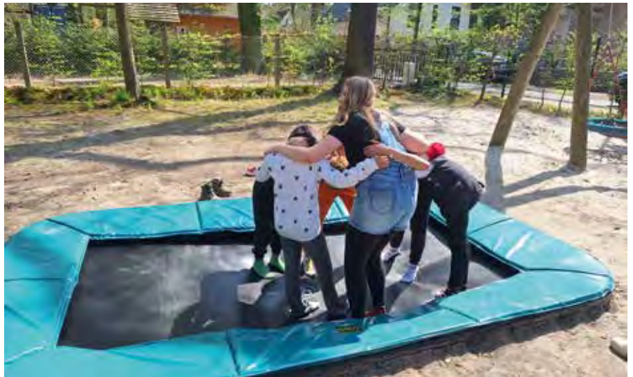
Der Traum der Kinder ging in Erfüllung: Jetzt können sie sich auf dem neuen Trampolin austoben.

Das absolute Highlight wartete jedoch zum Abschluss: Ein lang ersehnter Traum der Kinder ging endlich in Erfüllung. Dank zahlreicher gespendeter Pfandbons und weiterer großzügiger Zuwendungen konnte die Erneuerung des Trampolins finanziert werden. Ein herzliches Dankeschön gilt Herrn Vollert und seinem Team vom Kinderheim, die den fachgerechten Aufbau realisierten.