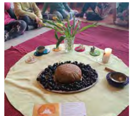
Zum Osterfrühstück ließen es sich die Kinder schmecken.