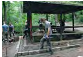
WorkCamp 2025 in Großbothen

Liebe interessierte Jugendliche und Junggebliebene, habt Ihr auch dieses Jahr Lust auf eine Woche voller Abenteuer, Spaß und gemeinsamen Schaffens? Auch in diesem Jahr findet wieder unser WorkCamp statt! Wir unterstützen die Kirchgemeinde Weltewitz dabei ihre historische Lehmmauer zu erhalten und andere Arbeiten umzusetzen, die alleine nicht gestemmt werden können. Vom 2. bis zum 9. August wollen wir gemeinsam Spaß haben und miteinander an den Herausforderungen wachsen. Nach der Arbeit möchten wir zusammen unsere Freizeit rund um Eilenburg gestalten, unter anderem Baden gehen und wie jedes Jahr unser „Eis-essen-satt“ veranstalten. Untergebracht sind wir im Pfarrhaus, wo uns neben diversen Räumen auch die Küche, Bäder