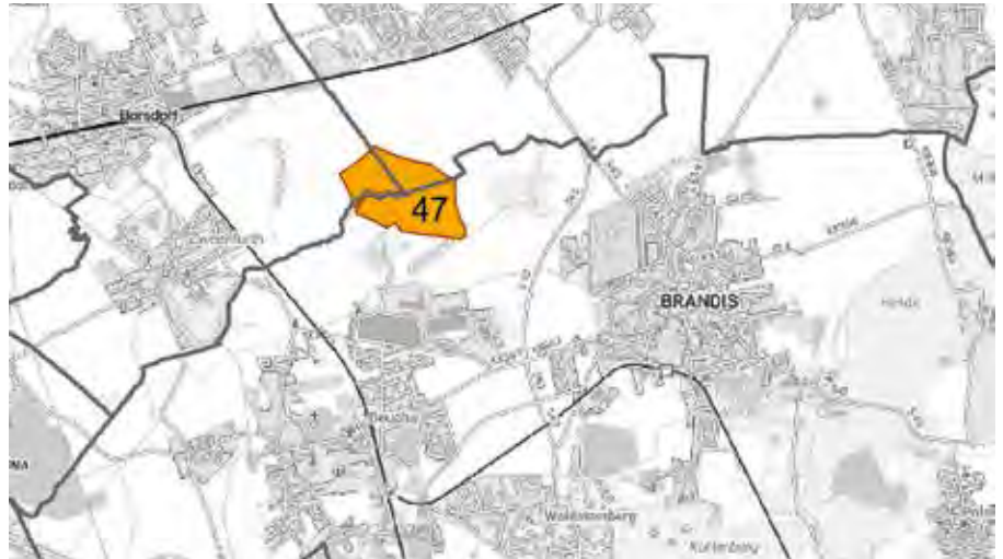
Das die Stadt Brandis betreffende Gebiet tangiert ebenso die Nachbarkommunen Borsdorf und Machern.

Es besteht erneut für jeden die Möglichkeit, Einwendungen gegen diese Planung zu erheben. Hierfür können Sie noch bis zum 15.06.2026 Ihre Einwendung an den Regi-