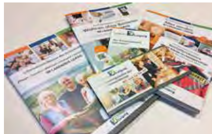
Die Infomappe des Kreissozialamtes gibt es im Brandiser Rathaus.

Neben wichtigen Kontaktadressen zu Pflegeleistungen, Ehrenamt, Wohngeld, Vorsorgevollmacht und Patientenverfügung informiert die Broschüre auch über die Arbeit der Beratungsstelle „Pflegenetzwerk“. Die Mitarbeiterinnen und Mitar-