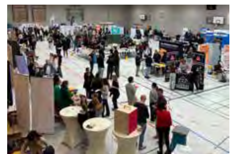
Die bereits 15. Berufsorientierungsmesse der Oberschule Brandis fand in der Mehrzweckhalle statt.

Wir danken allen Ausstellern und Organisatoren für die Teilnahme und Verbesserungsvorschläge. Im Nachgang haben wir