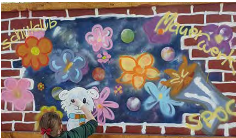
Seit 10 Jahren können sich Kinder und Jugendliche im Mauerwerk treffen und eine Menge erleben.