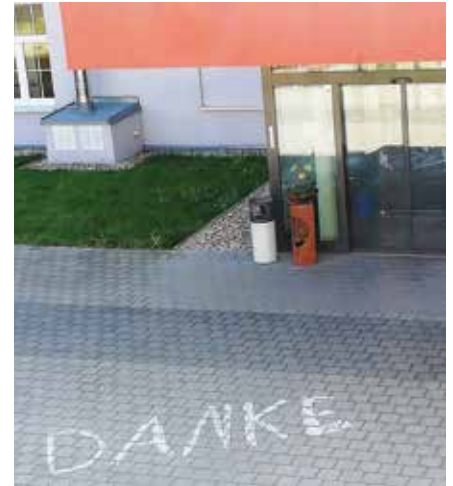
Bewohner und Mitarbeiter des AZURIT Seniorenzentrums Borna sagen „Danke“