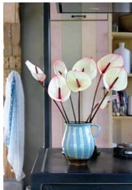
Diese Anthurien erinnern farblich an aromatisches Vanilleeis mit Waldbeersöße.