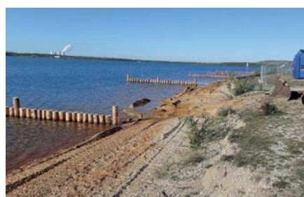
Aktuelles Uferschutzmaßnahmen am Störnthaler See fertiggestellt