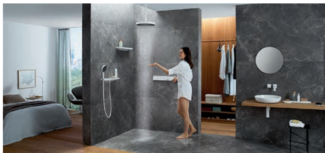
akz-o (Foto: hansgrohe/Hansgrohe SE/akz-o)

Ein breitgefächertes Sortiment bietet darüber hinaus noch viele weitere Möglichkeiten, den Duschbereich individuell nach den eigenen Ansprüchen auszustatten: Wand- oder Deckeninstallation, Showerpipe, Kopf- oder Handbrause, mit einer oder drei Strahlarten, die Handbrause im klassischen Design oder in der geometrischen Stabform. Die moderne Oberflächenfarbigkeit aus edlem mattem Weiß sowie das moderne Graphit der dezent strukturierten Strahlscheibe sorgen für ein optisches Highlight im Badezimmer, in dem Duschen zum Naturerlebnis wird. Weitere Informationen finden Sie auf www.hansgrohe.de