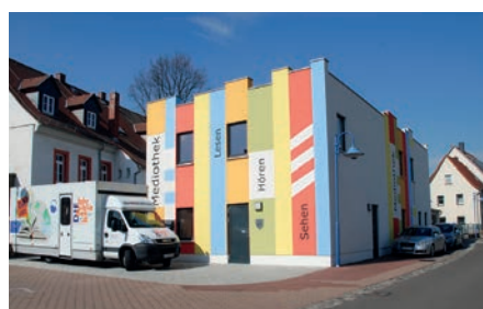
Aus der Stadtverwaltung Die Mediothek Borna ist weiterhin eingeschränkt geöffnet