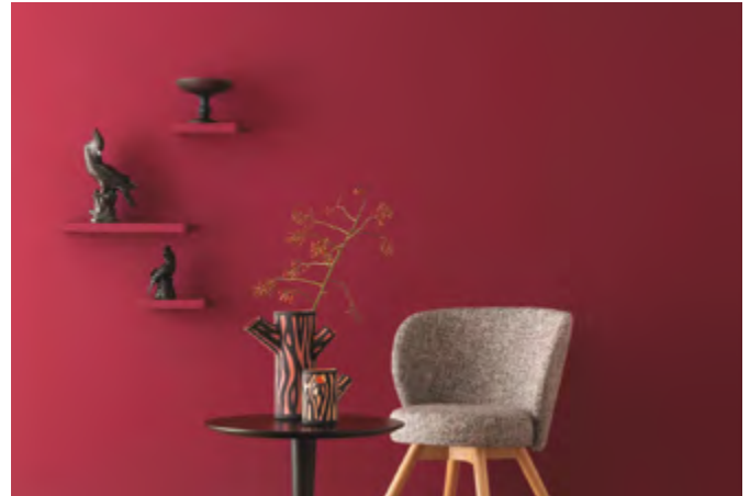
Einrichten im eigenen Stil: Warme Rottöne bringen Behaglichkeit in die Wohnung.