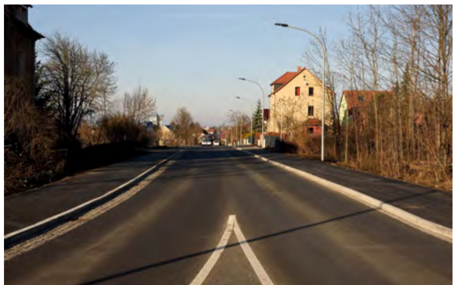
großes Bild: Blick auf die sanierte Leipziger Straße aus südlicher Richtung. links unten: Der kombinierte Fuß- und Radweg zwischen Borna und Zedtlitz ist jetzt vollständig ausgebaut.