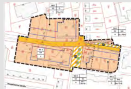
B-Plan Wohngebiet Gnardorf

In seiner Sitzung Anfang November erfolgte im Stadtrat die Abwägung der eingegangenen Stellungnahmen der Träger öffentlicher Belange zum Entwurf der ersten Änderung des Bebauungsplanes „Wohngebiet Gnardorf“.