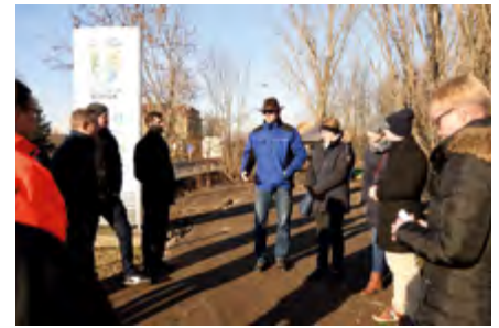
Vertreter aller am Bau beteiligter Firmen sowie der Großen Kreisstadt Borna trafen sich zur offiziellen Freigabe der Leipziger Straße.

Seit August 2020 ist die Leipziger Straße zwischen dem Kreuzungsbereich mit Kirchsteig/Altstädter Hauptstraße und dem südlichen Ortsausgang auf einer Gesamtlänge von über einem Kilometer grundhaft ausgebaut worden. Nach dem Abschluss der Bauarbeiten im letzten Abschnitt konnte die Strecke am Mittwoch, dem 22. Dezember 2021 nun offiziell wieder freigegeben werden. An der Gemeinschaftsmaßnahme beteiligten sich neben der Großen Kreisstadt Borna auch der Zweckverband Wasser/Abwasser Bornaer Land (ZBL) und die Städtische Werke Borna Netz GmbH (SWB Netz).