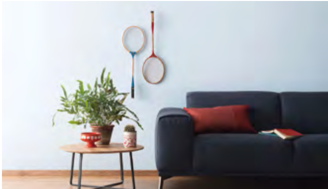
Frisch und klar: Helle Blautöne betonen eine Einrichtung im klaren skandinavischen Design.

Jeder Farbe werden spezielle Wirkungen zugeschrieben. Während Rot für Wärme und Behaglichkeit steht, schaffen Grün und Braun ein naturbezogenes Ambiente. Zudem lassen sie sich jeweils noch in unterschiedlichen Facetten von zart bis kräftig darstellen. Aus insgesamt 30 Varianten von sechs Grundtönen besteht beispielsweise die Designfarben-Kollektion von Schöner Wohnen-Farbe, die im Fachhandel und in vielen Baumärkten erhältlich ist. Von sonnigen Gelbnuancen über Rottöne, die Lebensfreude vermitteln, bis hin zu blauen Farben, die sehr gut etwa mit einem skandinavischen Wohnungsdesign harmonieren, reicht das Spektrum. Dass Grau alles andere als langweilig ist, zeigen seine fünf Varianten - vom elegant-klassischen Schieferferton bis zu einem sanften Seidengrau. Die Abstufungen der Farben Braun und Grün stehen für Harmonie, Natürlichkeit und Erneuerung.