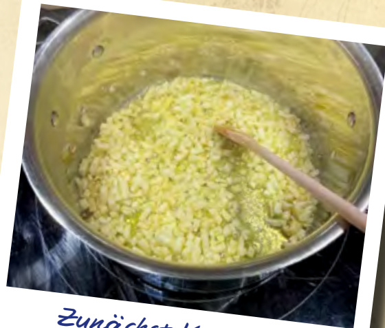
Zunächst Knoblauch andünsten