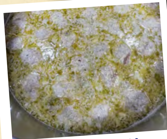
Neujahrsessen 2022: Unsere Knoblauchsuppe