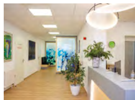
Blick in die neu gestalteten Praxisräume