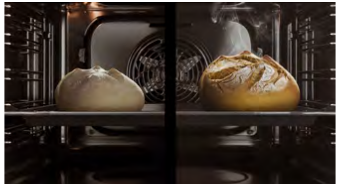
Bei der Zubereitung von Brot wird das Aufgehen des Teigs durch die Dampffunktion des Ofens verbessert, das Ergebnis zeichnet sich durch mehr Volumen und mehr Knusprigkeit aus.

Die Kochmethode des Dampfgarens wird in der professionellen Gastronomie schon lange geschätzt und hält immer häufiger Einzug auch in Privathaushalte. Ihre Vorteile liegen auf der Hand: Dank des drucklosen Garens im Wasserdampf werden die wertvollen Mineralstoffe und Vitamine der Lebensmittel fast vollständig erhalten, weil sie nicht im Kochwasser landen. Außerdem bleibt die Form knackig und die Farbe intensiv, die Speisen behalten ihr frisches Aroma und ihre Festigkeit. Da der Eigengeschmack der Nahrungsmittel besser zur Geltung kommt, muss nur sparsam gesalzen und gewürzt werden. Tatsächlich ist Dampf eine der ältesten Methoden, schonend zu garen. Bereits vor mehr als 1.000 Jahren begann man in China, Speisen nicht direkt im Wasser, sondern indirekt im Wasserdampf zuzubereiten. Verwendet wurden Bambuskörbe, die in einen mit Wasser gefüllten Wok gestellt, übereinandergestapelt und oben mit einem Deckel verschlossen wurden.