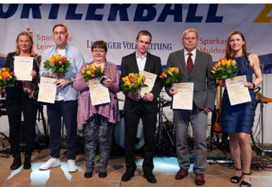
Auszeichnung für das Ehrenamt

Endlich! Am Samstag, den 23. April konnten sich die Sportlerinnen und Sportler des Landkreises wieder zum Sportlerball treffen, der schon zweimal zwecks Pandemie ausfallen musste. Es war die pure Freude der anwesenden Gäste aus Sport, Politik und