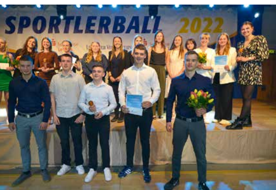
Auszeichnung der Mannschaft des Jahres