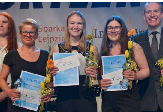
Auszeichnung der Sportlerinnen des Jahres