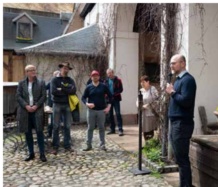
Eröffnungsveranstaltung im Burghof der Burg Gndenstein