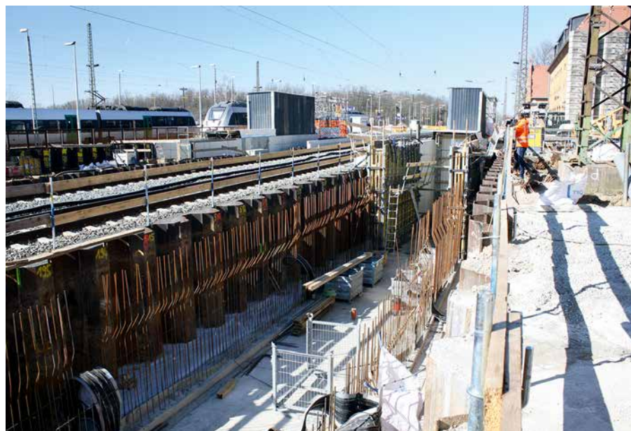
Rampe an Bahnsteig 1 ist im Bau. Im Hintergrund stehen die vorläufigen Treppeneinhausungen.

Im Oktober 2022 wird es eine weitere Sperrung geben. Anschließend soll der barrierefreie Ausbau des Bahnhofs mit den beiden neuen Rampen abgeschlossen sein. Der Bund und die Deutsche Bahn investieren dafür insgesamt rund 16 Millionen Euro.