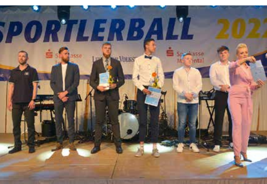
Auszeichnung der Sportler des Jahres