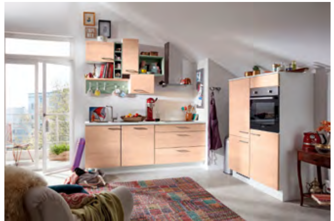
Helle Wandfarben und Küchenmöbel lassen den Raum größer erscheinen.

Praktisch sind auch Eckschränke mit Drehkarussell oder Ablageböden, die einzeln herausschwingen können, sowie extra hohe Wandschränke, die viel Platz für Geschirr, Besteck und Küchenutensilien bieten. So lässt sich der Stauraum maximieren, ohne den Bodenplatz zu beanspruchen. „Außerdem bleiben dadurch die Arbeitsflächen frei, was für eine saubere und aufgeräumte Atmosphäre sorgt“, so Steinmeier weiter. Auch die Nischenrückwand lässt sich nutzen. An Reling- und Schienensystemen etwa können Gewürzregale, Küchenrollenhalter oder täglich genutzte Utensilien wie Pfannenwender und Messer platziert werden. Eine weitere platzsparende Möglichkeit ist der Einbau eines Quookers: Dieser Wasserhahn liefert sofort kochendes Wasser – oder auch gekühltes, sprudelndes und stilles Wasser. Das ersetzt den Wasserkocher, den Soda-Automaten oder das Lagern von Wasserflaschen.