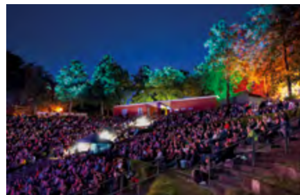
Archiv: 2018 lockte Albert Hammond 2.000 Besucher auf den Volksplatz

dem Deutschen Filmorchester Babelsberg als Orchesterversionen neu arrangiert. Das Album liefert die Grundlage für die diesjährige SYMPHONIC TOUR durch deutsche Konzerthäuser und Philharmonien. Der Stopp in Borna ist dabei in zweierlei Hinsicht besonders. Zum einen findet das Konzert hier unter freiem Himmel vor der Kulisse eines Amphitheaters statt. Zum anderen wird die Band in Borna vom Leipziger Symphonieorchester begleitet, welches in diesem Jahr sein 60-jähriges Bestehen feiert. Das Live-Konzert am 10.09. um 19.00 Uhr auf dem Volksplatz ist sozusagen das i-Tüpfelchen im Festjahr, was Sie sich nicht entgehen lassen sollten. Veranstaltet wird das Konzert von der Stadt Borna in Kooperation mit dem Förderverein des Leipziger Symphonieorchesters und dem Volksplatzverein, welcher sich an dem Abend um das leib-