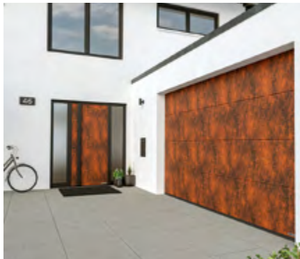
Tor- und Türdesign im Partnerlook: Für Hörmann Garagen-Sektionaltore sind fünf neue Duragrain Dekore erhältlich, die perfekt auf die Decoral Dekore der Aluminium-Haustüren ThermoSafe abgestimmt sind.

Die Haustür und das Garagentor tragen maßgeblich zum Erscheinungsbild der Hausfassade bei. Bauherren und Modernisierer, die Wert auf ein besonders harmonisches Gesamtbild ihres Zuhauses legen, können nun das Tor- und Türdesign perfekt aufeinander abstimmen.