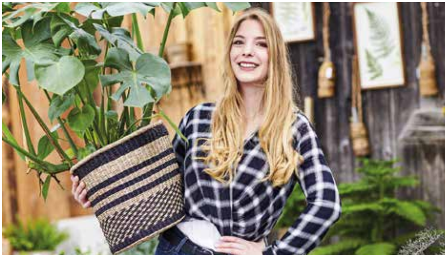
Wer beim Transport von Zimmerpflanzen ein paar wichtige Dinge beachtet, bringt seine neuen Mitbewohner heil und gesund nach Hause. Welche das sind? Die Internetseite natuerlich-schoene-augeblicke.de gibt Tipps.

Zimmerpflanzen wie Monstera, Alpenveilchen, Orchidee und Weihnachtsstern beleben in den kahlen Wintermonaten Wohnräume mit ihrem immerfrischen Grün. Doch wie transportiert man die neuen Mitbewohner am besten bei Kälte und Schnee? Mit diesen Tipps bringen Sie Ihre Pflanzen sicher nach Hause – für viele natürlich schöne Augenblicke im warmen Zuhause! Luftige Kleidung bei Hitze, wärmende bei Kälte: Je nach Jahreszeit, Wetter und Temperatur ziehen Menschen sich unterschiedlich an. Zimmerpflanzen hingegen haben meist keine wechselnde Garderobe. Sommer wie Winter tragen sie ihr grünes Blätterkleid, wahlweise geschmückt