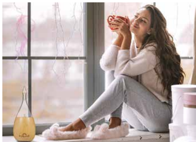
Wer es sich zu Hause kuschelig macht, braucht den Winterblues nicht zu fürchten.

Graue Tage, wenig Licht und nasskaltes Wetter trüben bei vielen Menschen die Stimmung. Doch das muss nicht so bleiben. Um dem Winterblues entgegenzuwirken, empfehlen Gesundheitsexperten eine ausgewogene Ernährung, ausreichend Schlaf und regelmäßige Bewegung an der frischen Luft. Wer seinen inneren Schweinehund trotz Nieselregen oder Graupelschauer überwindet, wird sehr schnell feststellen, dass schon ein kurzer Spaziergang zu mehr Lebensfreude beitragen kann. Für zu Hause ist es ratsam, sich eine heimelige Atmosphäre zu schaffen. Kuschelige Decken, heißer Tee und viele brennende Kerzen sorgen für Gemütlichkeit.