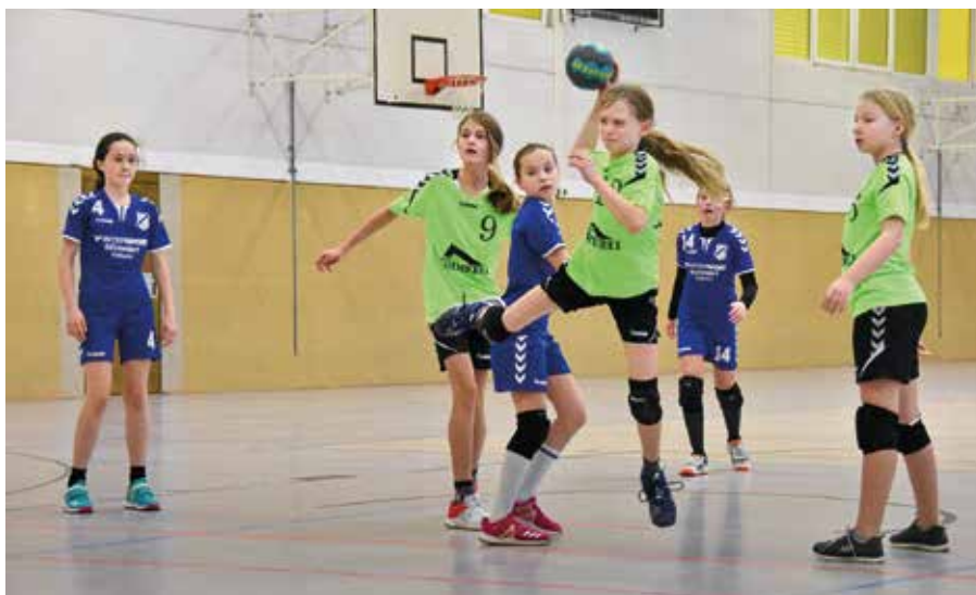
Spiel der D-Jugend (wbl.) gegen die HSG Neudorf/Döbeln

Die Sektion hat derzeit rund 120 Mitglieder, davon sind 78 Kinder und Jugendliche. Die Jugendlichen spielen in vier Mannschaften – die jüngsten in der E-Jugend – und nehmen am Liga-Spielbetrieb teil. Die Herren trainieren zwei Mal pro Woche, mittwochs und freitags, jeweils anderthalb bzw. zwei Stunden. Die Kinder und Jugendlichen trainieren freitags von 16.00 bis 20.00 Uhr. Mittwochs findet das