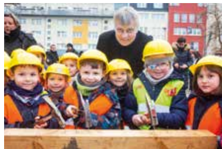
Markkleeberg aktuell Richtfest für Kita „Am Wasserturm“