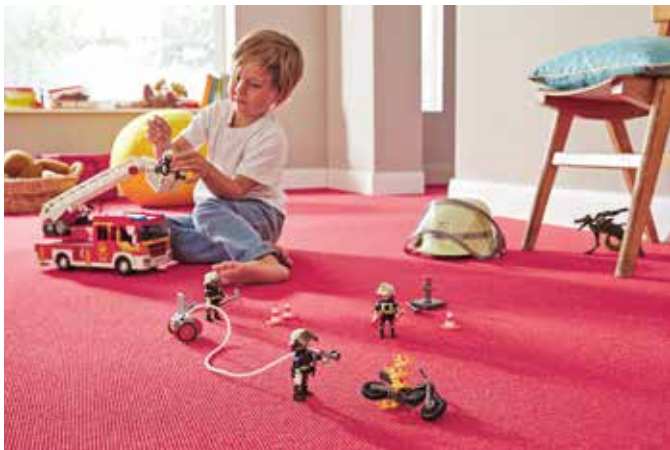
Tatü, tata, hier kommt die Feuerwehr. Damit die Männchen nicht umfallen, sollte der Teppich im Spielzimmer kurzflorig sein. Das gibt einen besseren Stand.

Teppich mit Kaschmir-Ziegenhaar und Schurwolle ist wohngesund und praktisch