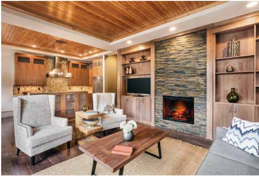
Die Profis von Dimplex entwickeln ihre Modelle mit Leidenschaft. Vor allem die täuschend echten Flammeneffekte begeistern. Wann hat man schließlich schon mal die Möglichkeit, sein ganz individuelles Feuererlebnis auszuwählen?

Elektrokamine bringen faszinierendes Flammenspiel in die eigenen vier Wände