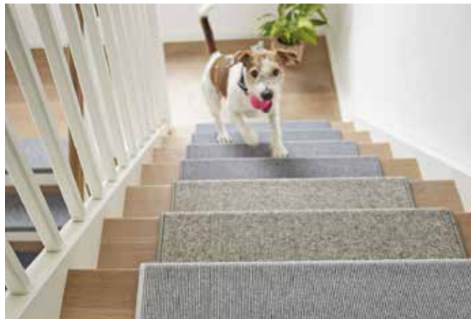
Wenn der Hund zu Hause Treppen laufen muss, erleichtern ihm Stufenmatten den Aufstieg. Sie machen die Stufen weniger rutschig.

Wer einen Hund oder eine Katze besitzt, kennt die Masse an Haaren, die sie über das Jahr verlieren. Anders als viele denken,