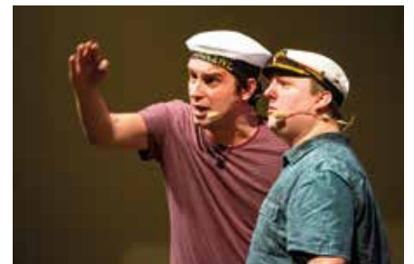
Markkleeberger Bilderbogen Neujahrsempfang der Stadt Markkleeberg