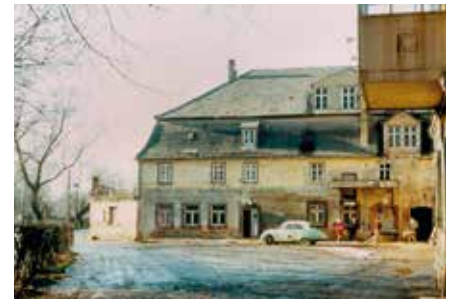
Hofseite im Jahr 1971