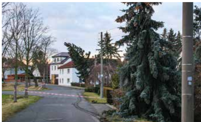
Die Bornaer Chaussee im Januar 2018