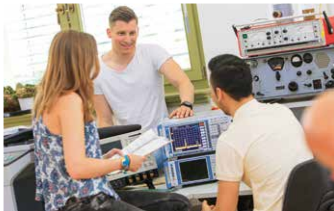
Drei Studiengänge haben es in diesem Jahr unter die besten Zehn des „WiWo“-Rankings geschafft.