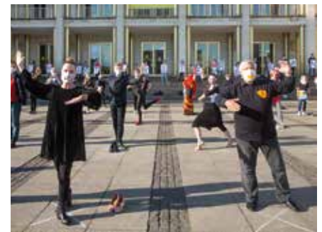
Aktion der Tanzschulen der Region am Welttag des Tanzes auf dem Augustusplatz

Inhaber von mehr als 20 Tanzschulen standen symbolisch still, als die Musik auf dem Augustusplatz pünktlich 18.00 Uhr ertönte. Aufgrund der Auflagen seitens des Ordnungsamtes war das Tanzen aber verboten. Einen „Langsamen Walzer“ am Platz