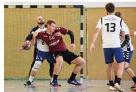
Markkleeberger Handballturnier im letzten Jahr

Leider ebenfalls verschoben werden muss das 24. Markkleeberger Handballturnier 2020. Grund dafür ist zum einen die aktuelle und wahrscheinlich noch eine Weile unklare Corona-Situation, auch im Hinblick auf die folgende Saison 2020/2021. Zum anderen wird die Dreifelderhalle zurzeit umfassend saniert und steht nicht als Austragungsort zur Verfügung. Die Ausweichhalle in der Mehringstraße ist platztechnisch nicht für einen Modus mit mehr als zwei Teams geeignet. Das Turnier soll im nächsten Jahr nachgeholt werden.