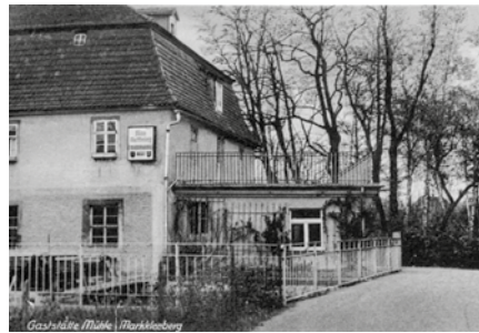
Gaststätte „Mühle Markkleeberg“