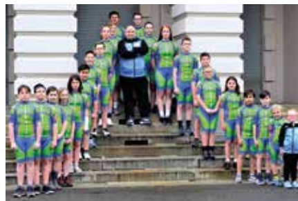
Verein Radsport- und Fitnessclub M'berg e.V.