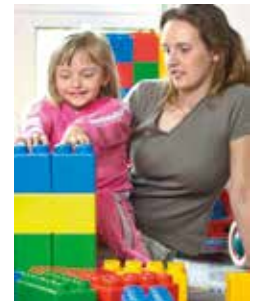
Im Spielzimmer der Kinderklinik

spezielle Kinderstation mit bunt gestalteten Zimmern, Spielecken und speziell geschultem Pflegepersonal. Darüber hinaus legt das Ärzte- und Pflegeteam um Dr. Möckel großen Wert auf die Einbindung der Familie. In eigens geschaffenen Mutter-Kind-Zimmern bietet sich bei Bedarf die Möglichkeit, ein Elternteil mit aufzunehmen – auch für Neugeborene mit gesundheitlichen Problemen. Frühchen, d.h. Kinder, die vor vollendeter 37. Schwangerschaftswoche geboren werden, können auf der angrenzenden kinderärztlichen Intensivbetreuungseinheit auf dem neuesten Stand medizinisch und pflegerisch betreut werden und rund um die Uhr bei ihrer Mutter bleiben. Die Intensivstation ist Teil des Perinatalzentrums der Stufe II, das mit seinen medizinischen und personellen Ressourcen auf eine schnellst- und bestmögliche Rund-um-die-Uhr-Betreuung spezialisiert ist. „Im Zentrum können wir zusammen mit den Kolleginnen und Kollegen der Geburtshilfe Frühgeborene aus Einlings-Schwangerschaften ab 29, Zwillinge ab 30 Schwangerschaftswochen betreuen“, erklärt Dr. Möckel. „Sie werden durch modernes Monitoring überwacht und notwendige Körperfunktionen – wie beispielsweise Atmung und Kreislauf – durch modernste Technik unterstützt.“