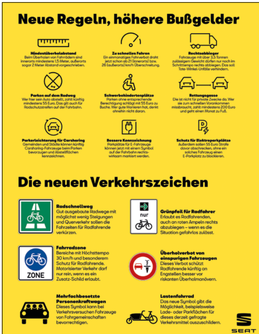
Neue Regeln, höhere Bußgelder.

Drei weitere neue Symbole komplettieren den Kreis neuer Zeichen, die schon bald auf Schildern zu finden sein können. Eines davon ermöglicht es Gemeinden und Städten, Carsharing-Fahrzeuge beim Parken zu bevorzugen und entsprechende Abstellflächen eindeutig und rechtssicher zu kennzeichnen. Ein weiteres Symbol erleichtert die eindeutige Markierung von Parkplätzen für Elektrofahrzeuge, während das dritte stilisiert drei Personen in einem Fahrzeug von vorne zeigt – und bei der versuchsweisen Freigabe einer Busspur für Fahrgemeinschaften ein entsprechend besetztes Fahrzeug meint.