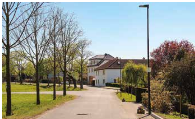
Bornaer Chaussee im April 2020

Der Sturm „Friederike“ sorgte im Jahr 2018 dafür, dass große Teile der Stromversorgung bzw. der öffentlichen Straßenbeleuchtung in Wachau-Auenhain flächenmäßig fast zwei Tage ausgefallen waren. Mit der Beseitigung der Schäden entwickelte das Tiefbauamt der Stadt Markkleeberg ein Konzept für eine größere Versorgungssicherheit in diesem Gebiet.