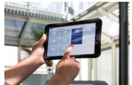
Bauen/Wohnen/Einrichten Smarter Sonnenschutz