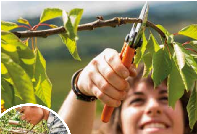
Mit dem Rückschnitt ihrer Obstbäume schaffen Gartenbesitzer die Basis für neues Wachstum und eine reiche Ernte in der kommenden Saison. Akkubetriebene Gartenhelfer sorgen für saubere Schnitte und ein kräfteschonendes Arbeiten.

Wie alle Pflanzen benötigen auch Bäume und Sträucher Pflege – und danken mit neuem Austrieb. Neben regelmäßigen Fassonschnitten, die während der Saison aus optischen Gründen