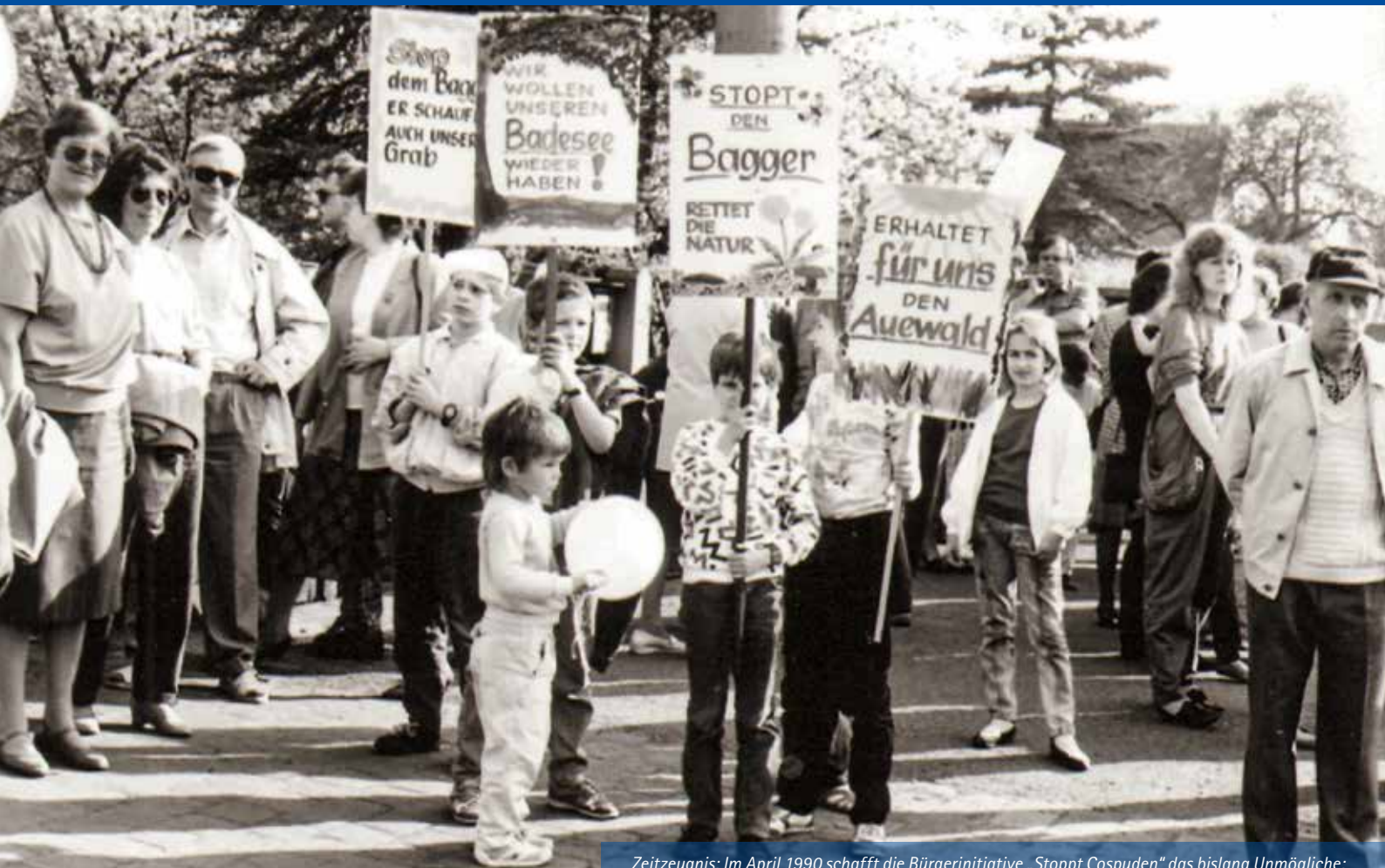
Zeitzeugnis: Im April 1990 schafft die Bürgerinitiative „Stoppt Cospuden“ das bislang Unmögliche: Der Freilegungsbetrieb des Tagebaus wird beendet.

Amts- und Mitteilungsblatt der Großen Kreisstadt Markkleeberg