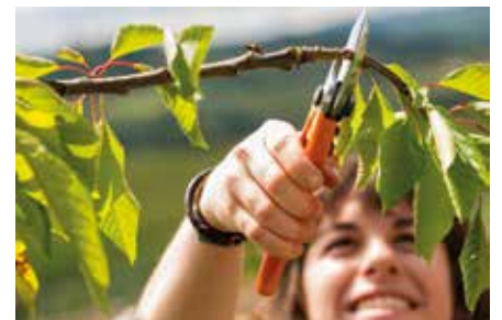
Bauen/Wohnen/Einrichten Im Herbst wird es schnittig