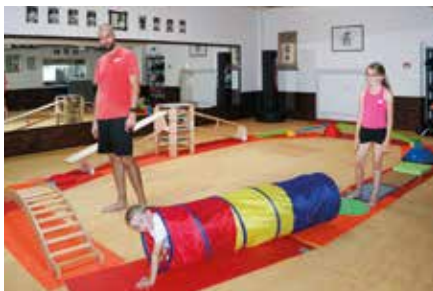
Verein Kindersport für Mädchen und Jungen