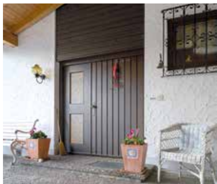
Haustürtausch an nur einem Tag.