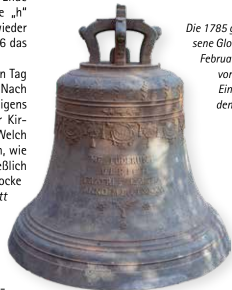
Die 1785 gegossene Glocke im Februar 2020 vor ihrem Einbau in den Turm.

■ Weitere Bilder der Glockenweihe und dem Tag des offenen Denkmals finden Sie auf unserem Bilderbogen auf Seite 9.