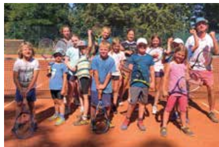
Markkleeberg aktuell Sommercamp des TC Markkleeberg e. V.