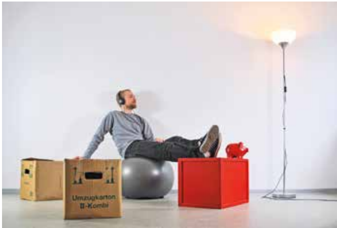
Studenten und Berufsanfänger sind stolz auf ihre erste eigene Wohnung. Eine solide Finanzplanung schützt dabei vor bösen Überraschungen.

Studenten und Berufsanfänger sollten ihr Budget checken