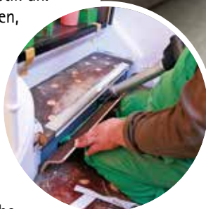
Die Portas-Treppenrenovierung im Vinyl-Dekor „Eiche royal“ bietet einen eindrucksvollen Blickfang. Treppe und Boden sind in Holzoptik gefertigt, was sich optisch von echtem Holz kaum unterscheiden lässt.

Links: Mit Schrauben fest im Treppenkern befestigt, bildet der Stabilisierungswinkel die Basis für jede neue Stufe.