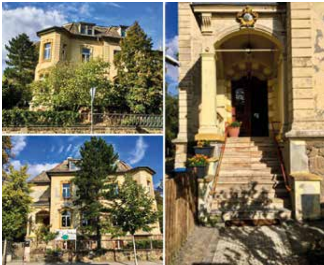
Denkmalgeschützte Villa in der Hauptstraße 15.

Die Stadt Markkleeberg fordert für das nachfolgend aufgeführte voll erschlossene Villengrundstück, Hauptstraße 15 in 04416 Markkleeberg auf, Angebote zum Erbbaurecht abzugeben: