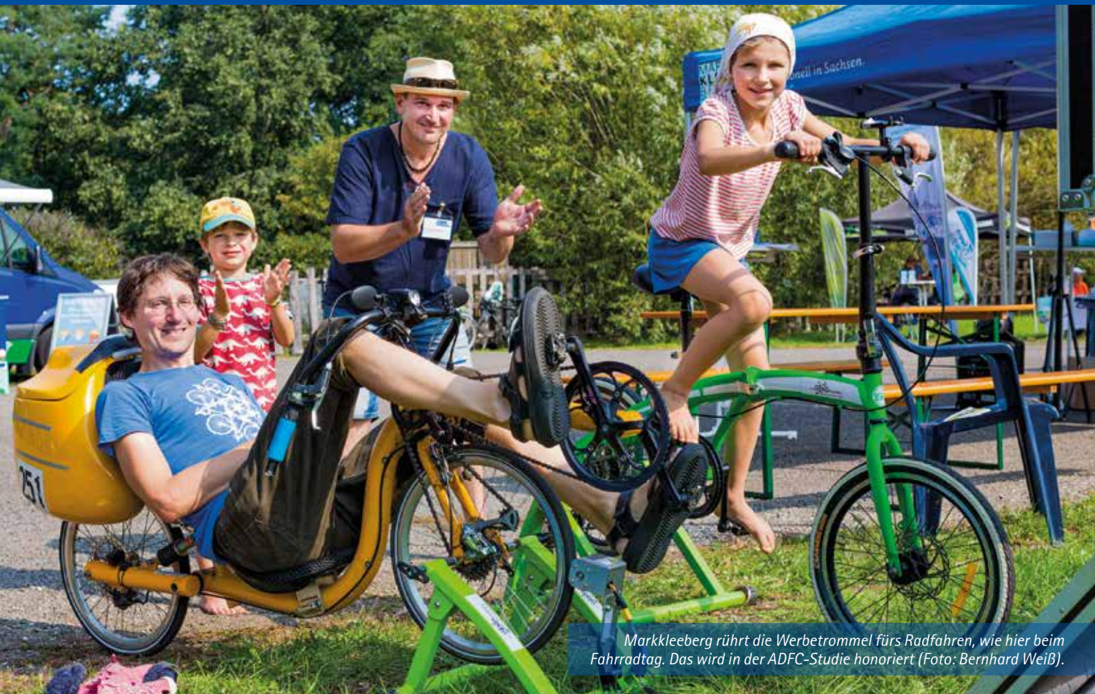
Markkleeberg rührt die Werbetrommel fürs Radfahren, wie hier beim Fahrradtag. Das wird in der ADFC-Studie honoriert.

Amts- und Mitteilungsblatt der Großen Kreisstadt Markkleeberg