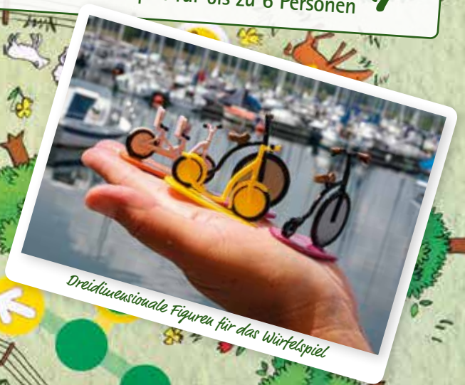
Dreidimensionale Figuren für das Würfelspiel