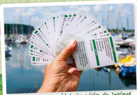
80 knifflige Fragen und Aufgaben erhöhen den Spielspaß