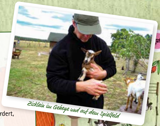
Zicklein im Gehege und auf dem Spielfeld