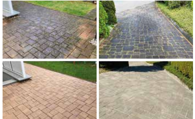
Zwei Steinflächen jeweils vor (oben) und nach der Sanierung (unten).

■ Ohne Sanierung – nur Flechten und Schwarzalgen Auf rauen Steinoberflächen – egal ob imprägniert oder nicht – lagert sich schnell Staub und Schmutz ab. Zusammen mit Feuchtigkeit sind aufgeraute Steinflächen ein idealer Nährboden für mikroskopisch kleine „Pflanzkübel“ – die Ursache für hässliche Flechten und für gefährlichen, rutschigen Moosbewuchs. Eingangsbereiche und Gartenwege werden so in kurzer Zeit zu gefährlichen Rutschbahnen.