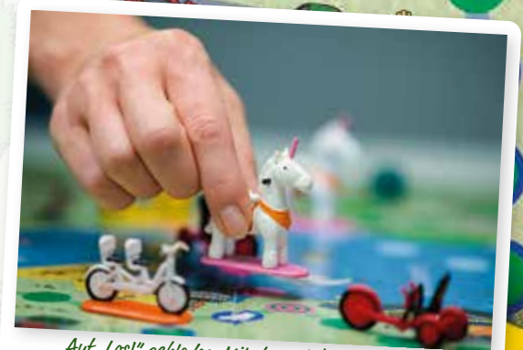
Auf „Los!“ gehts los: Mit dem Einhorn eine Runde um den Cospudener See.