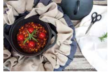
Energiesparend, gesund und lecker kochen mit dem Ecostof.

Auf dem Ecostof Youtube-Kanal wird Schritt für Schritt erklärt, wie das Kochen mit dem Ecostof funktioniert.