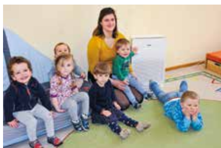
Markkleeberg aktuell Kita „Alleskönner“ erhält Luftreiniger