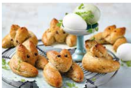
Ostern-Spezial Rezept-Idee: Herzhafte Osterhäschen