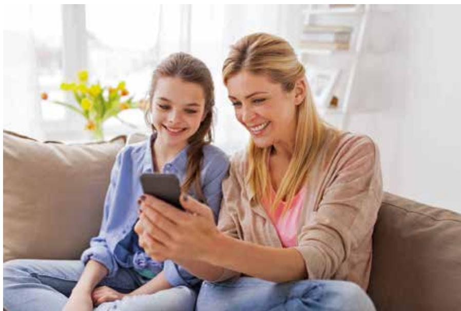
Per Smartphone-App oder auf dem Tablet können Eltern, Lehrer auf der Klassenfahrt oder Freunde die Glukosewerte der Teens kontinuierlich mitverfolgen.

Die Stoffwechselerkrankung kann heute gut behandelt werden. Eine engmaschige ärztliche Begleitung und ein kontinuierliches Diabetesmanagement sind hier gefragt. Das kann zu einer guten Glukoseeinstellung führen. Genau hier liegt jedoch auch häufig die Schwierigkeit. Denn Jugendliche haben zumeist ganz andere Dinge im Kopf, als regelmäßig ihre Werte zu kontrollieren. Hinzu kommt, dass die Pubertät die Hormone verrücktspielen lässt, was sich auf den Insulinbedarf auswirken kann. Zumal auch ein unregelmäßiger Tagesablauf, Feiern oder Alkohol den Zuckerspiegel beeinflussen können. Support im Diabetesmanagement geben sogenannte rtCGM-Systeme wie Dexcom G6. Über einen Sensor an der Oberarmrückseite oder am Bauch sowie bei Kindern und Jugendlichen ab zwei bis zu 17 Jahren im oberen Gesäßbereich misst es kontinuierlich den Gewebezucker im Unterhautfettgewebe und sendet diese Werte alle fünf Minuten ans Smartphone. Im Falle von bevorstehender Über- oder Unterzu-