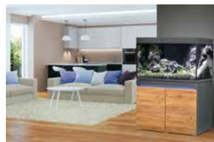
Bauen/Wohnen/Einrichten Tierische Stimmungsaufheller