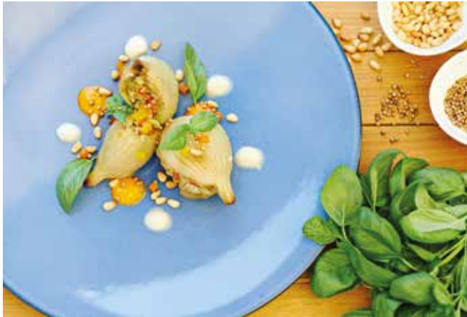
Rohkost und saisonales Gemüse sollten feste Bestandteile des Speiseplans werden.

Tipps der ältesten Heilmedizin helfen Zivilisationsbeschwerden und Stress abzubauen