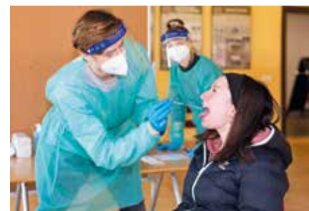
Interessierte Markkleebergerinnen und Markkleeberger erhalten einmal pro Woche einen kostenlosen Antigen-Schnelltest.

„Trotzdem stehen wir noch vor großen Herausforderungen, da hoffentlich zeitnah beispielsweise wieder der Kulturbereich öffnen oder die Kinder und Erwachsenen aus dem Vereinssport ihrem persönlichen Hobbys nachgehen dürfen. Somit müssen wir es schaffen, den Bürger tagesaktuelle Testungen zu ermöglichen, damit sie kulturelle Einrichtungen besuchen, ihrem Sport nachgehen oder tägliche Termine wahrnehmen können. Den organisatorischen Aufwand werden wir uns zur Aufgabe machen und ver-