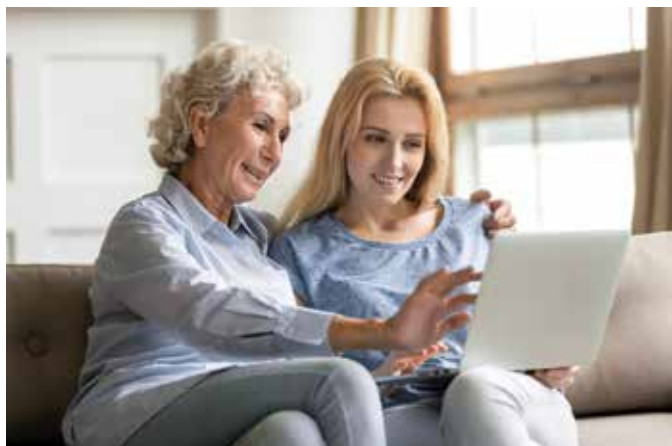
Im Sommersemester der Wissenschaftlichen Weiterbildung sitzen die Teilnehmenden in einem digitalen Hörsaal.

Auch bei der Wissenschaftlichen Weiterbildung der Universität Leipzig startet das Sommersemester digital: Die Teilnehmerinnen und Teilnehmer erwartet ein vielfältiges Themenangebot, unter anderem die neuen Vorlesungsreihen „Wissenschaft kompakt“. Die Veranstaltungen können als Livestream verfolgt oder als zeit- und ortsunabhängiges Video von der Weiterbildungsplattform der Universität abgerufen werden. Ende April geht es los. Anmeldungen sind ab sofort möglich.