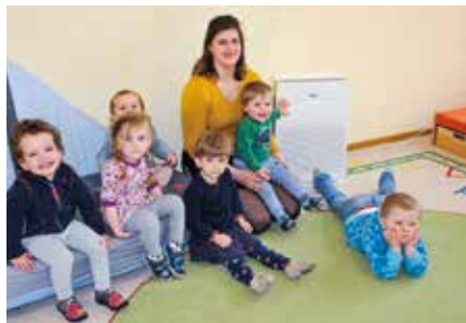
Die kleinen „Alleskönner“ sind glücklich über die Luftreiniger.

Seit Mitte März sorgen in der Kita „Alleskönner“ zehn Luftreiniger, ein Gerät kostete circa 350 Euro, für gutes Raumklima. Die Mutter einer Mitarbeiterin hatte die Idee: Als Privatperson wollte sie der Kita unkompliziert etwas Gutes tun, etwas, wovon alle Tag für Tag was haben.