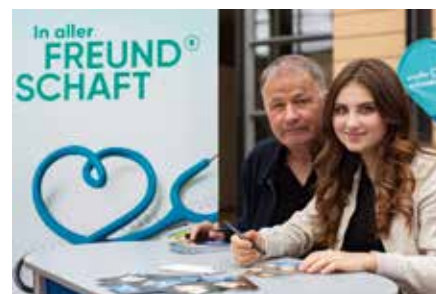
Markkleeberg aktuell 25 Jahre „In aller Freundschaft“