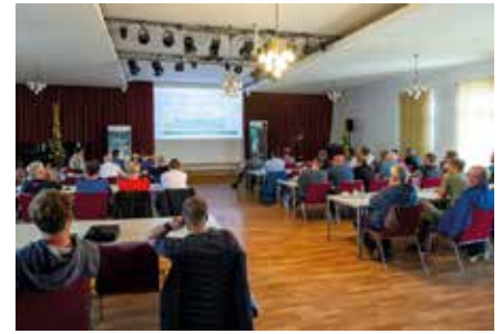
Infoveranstaltung im Kulturhaus Böhlen

Im bereits beschlossenen Gebäudeenergiegesetz (GEG) wurde geregelt, welche energetischen Anforderungen zukünftig an beheizte und klimatisierte Gebäude gestellt werden. Das Wichtigste zur Eingangsfrage: Wenn eine Heizung ab Januar 2024 kaputt geht, darf sie grundsätzlich repariert werden. Bestandsheizungen kön-