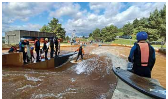
Beim „Herbst Surf Special“ herrschte auf beiden Wellen reger Betrieb.

Ein goldener Herbsttag mit Sonnenschein und angenehmen Wassertemperaturen ließ die Surfsaison 2023 perfekt ausklingen.