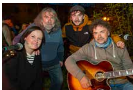
Verein Folk-Rock-Band „Old Way“