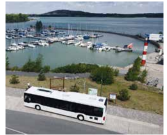
Bus am Störnthaler See