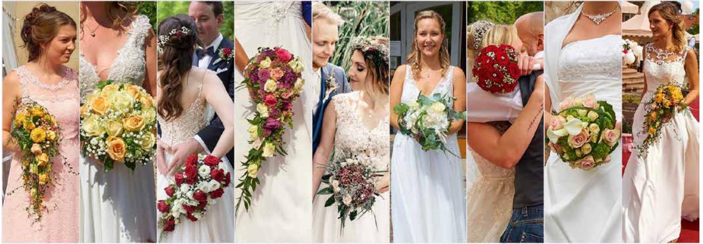
Wer sich traut, kommt zu uns: Jede Hochzeit ist individuell in Blüten, Farbe, Stil und Thema

mit traumhaften Blüten für einen traumhaften Tag