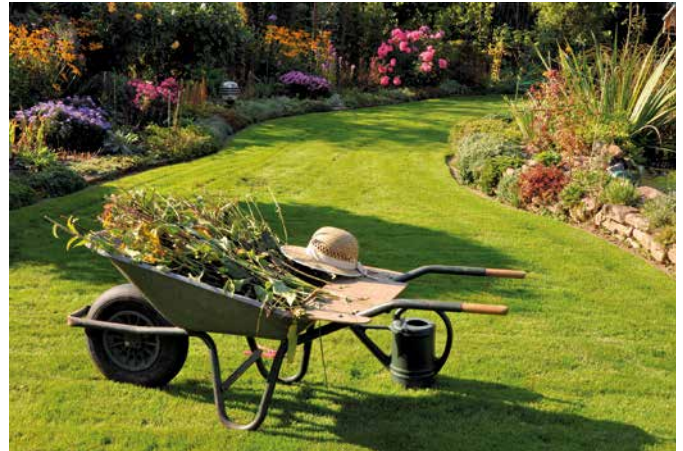
Nun ist der richtige Zeitpunkt für den Rückschnitt.

Viele Ziergräser und spätblühende Stauden haben den Winter über mit ihren Halmen und Samenständen Struktur in den Garten gebracht. Nun ist der richtige Zeitpunkt für den Rückschnitt – circa eine Handbreit über dem Boden –, bevor der frische Austrieb beginnt. Auch spätblühende Stauden wie Herbstastern oder Fetthenne werden bodennah ein-