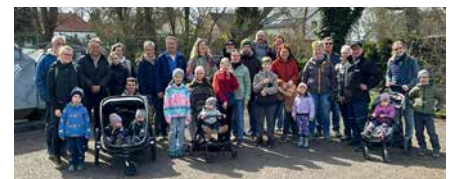
Gruppe des Ortschaftsrat Albrechtshain/Eicha/Erdmannshain