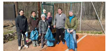
Teilnehmende des TC Rot-Weiß Naunhof