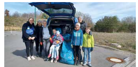
Gruppe Marmorweg bis und entlang Südufer Grillensee