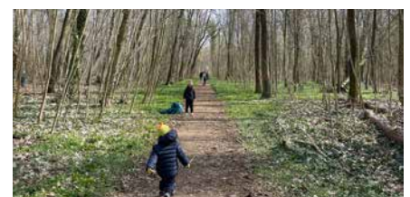
AktivSport SAXONIA e.V.