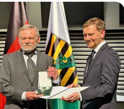
Ein Wurzener bekam 2024 den Verdienstorden ... > Seite 17