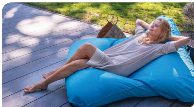
Endlich abschalten: Hochwertige Terrassendielen machen wenig Arbeit und lassen Zeit für das Wesentliche.

Wer ein Haus besitzt, kennt es nur zu gut: Jedes Jahr gibt es etwas, das man erneuern könnte. Zu den am häufigsten renovierten Bereichen zählen laut Statista unter anderem die Küche, das Bad und die Terrasse. Letztere wollten im Jahr 2023 rund 2,65 Millionen Deutsche in den nächsten ein oder zwei Jahren renovieren. Um mit einer neuen Terrasse viele Sommer lang zufrieden zu sein, sollte man vier Punkte beachten: