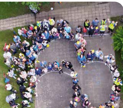
65-jähriges Jubiläum in der Kita Märchenland > Seite 7