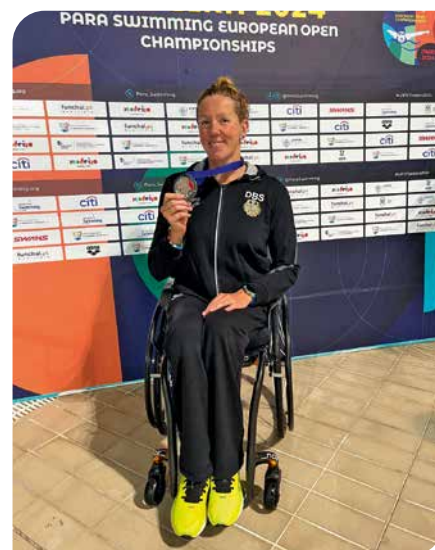
Verena Schott als Europameisterin 2024 mit der Goldmedaille über 100 m Rücken