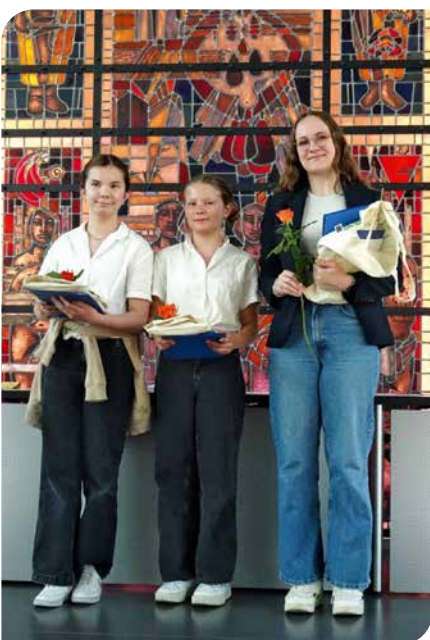
Alle drei Preisträgerinnen konnten am 15. Mai glücklich ihre Preise von Landes- und Bundesebene im Zwickauer Rathaus in Empfang nehmen.