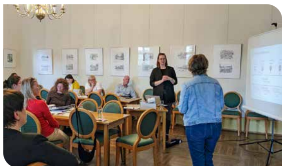
Besuch des im Bau befindlichen Holzhackschnitzel-Heizwerks in Röcknitz