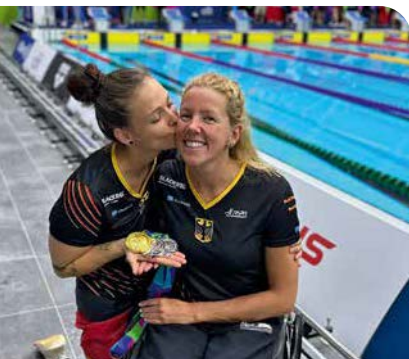
Auf den Spuren von Verena Schott > Seite 19