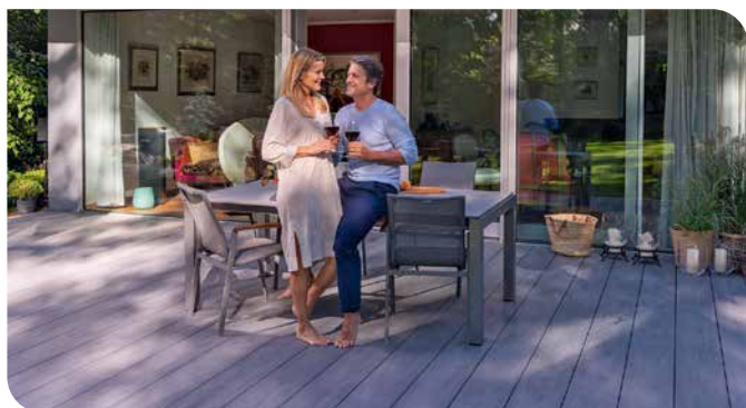
Auf einer renovierten Terrasse lassen sich viele schöne Sommertage genießen.

Mit diesen Tipps haben Sie langfristig etwas von der Renovierung