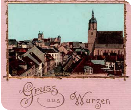
Detail Postkarte „Gruss aus Wurzen“, um 1900

Wer kennt sie nicht, die klitzekleine Notlüge? Manchmal biegen wir uns auch eine Geschichte so zurecht, dass sie spannender, lustiger oder gruseliger ist. Bei den Geschichten rund um die Stadt Wurzen ist das eigentlich nicht notwendig, denn hier gibt es allerlei Seltsames zu berichten. Da fällt die Wahl zwischen Wahrheit und Lüge gar nicht so leicht.