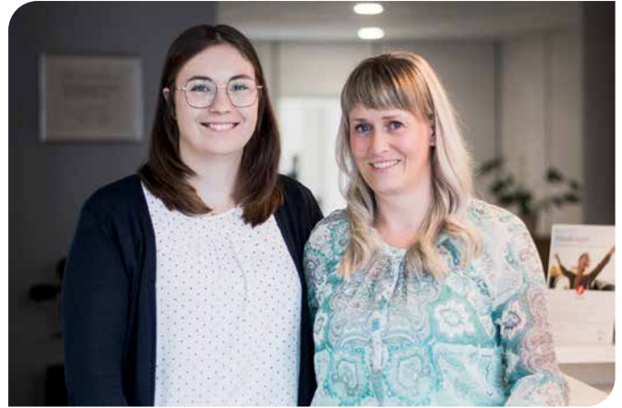
Das Würzener Hörconcept-Team berät Sie gern.

Das Fazit ist, dass Gehörgesundheit ein essenzieller Bestandteil des allgemeinen Wohlbefindens ist und sollte keinesfalls vernachlässigt werden. Angesichts der alarmierenden Verbindung zwischen Hörverlust und Demenz ist es entscheidend, präventive Maßnahmen zu ergreifen und das Bewusstsein in der Bevölkerung zu schärfen. Indem wir uns um unser Gehör kümmern, leisten wir einen wichtigen Beitrag zur langfristigen kognitiven Gesundheit.