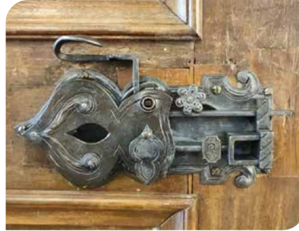
Türschloss Museum Wurzen, 18. Jhd.

Einmal durch die quietschende Museumstür gegangen, ist der Weg nach draußen durch mehrere Zahlenschlösser versperrt. Nun heißt es die Rätselaufgaben lösen und die Codes für die Schlösser herausfinden. Es geht vom Keller bis nach oben quer durch die Zeit. Mit etwas Glück lösen wir alle Aufgaben und schaffen es wieder aus den alten Mauern heraus.