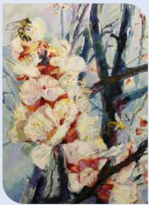
„Frühlingswind“ im Klinkhardt-Bau – die Dresdner Malerin Mandy Friedrich zeigt farbstärke Bilder

noch bis 16. September 2024 im Klinkhardt-Bau, Wurzen