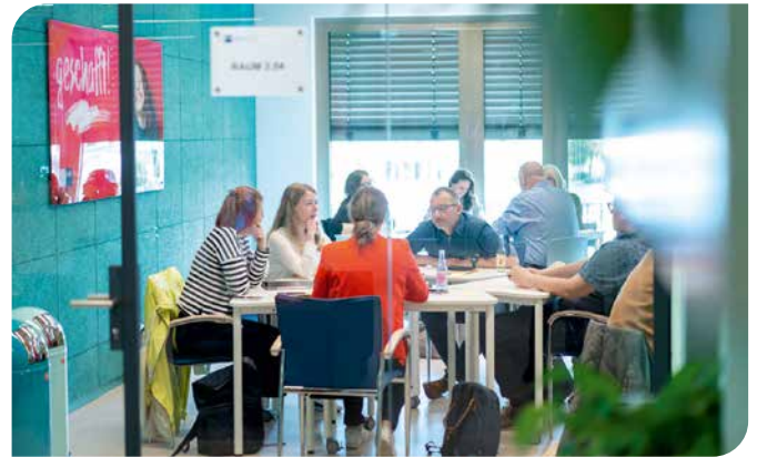
Zum Lehrgang „Geprüfte/-r Betriebswirt/-in“ gehören auch Gruppenarbeitsphasen.

Zugelassen werden ausgebildete Fachwirte und Fachwirtinnen, Fachkaufmänner und -frauen oder andere Berufserfahrene mit einem vergleichbaren kaufmännischen Fortbildungsabschluss nach dem Berufsbildungsgesetz. Die Berufspraxis der Bewerber muss inhaltlich wesentliche Bezüge zu den Aufgaben eines