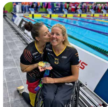
Gratulation am Beckenrand