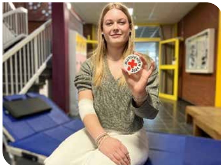
Junge Erstspenderin, die nach ihrer Blutspende die Information über ihre Blutgruppe erhält

Auch während der Sommer- und Ferienzeit können nur kontinuierliche Blutspenden die Patientenversorgung absichern