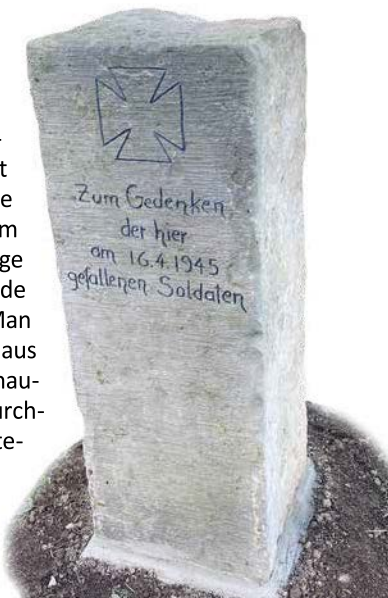
Wilfried Römling Wurzenener Geschichts- und Altstadtverein

In einer kleinen Gedenkfeier wurde die Säule am 16. Dezember 2025 am neuen Standort eingeweiht. Die vollständige Geschichte kann nun jeder im Schaukasten nachlesen. Einige Anwesende sprachen mahnende und nachdenkliche Worte. Man war sich einig, dass hier durchaus die Möglichkeit besteht, anschaulichen Geschichtsunterricht durchzuführen, und hofft auf viele interessierte Besucher.