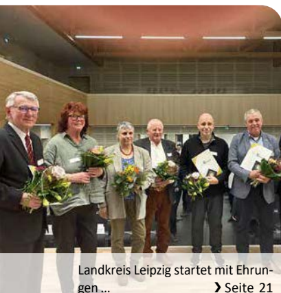
Landkreis Leipzig startet mit Ehrungen ... ➤ Seite 21