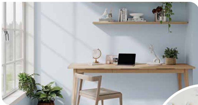
Die sehr ergiebige Farbe lässt sich rollen oder streichen.