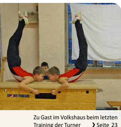
Zu Gast im Volkshaus beim letzten Training der Turner ➤ Seite 23