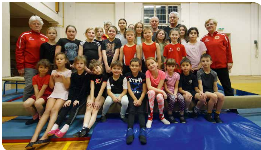
Der Wurzenener Turnernachwuchs und seine Übungsleiter beim letzten Mannschaftsfoto im Volkshaus.