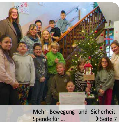
Mehr Bewegung und Sicherheit: Spende für ... ➤ Seite 7